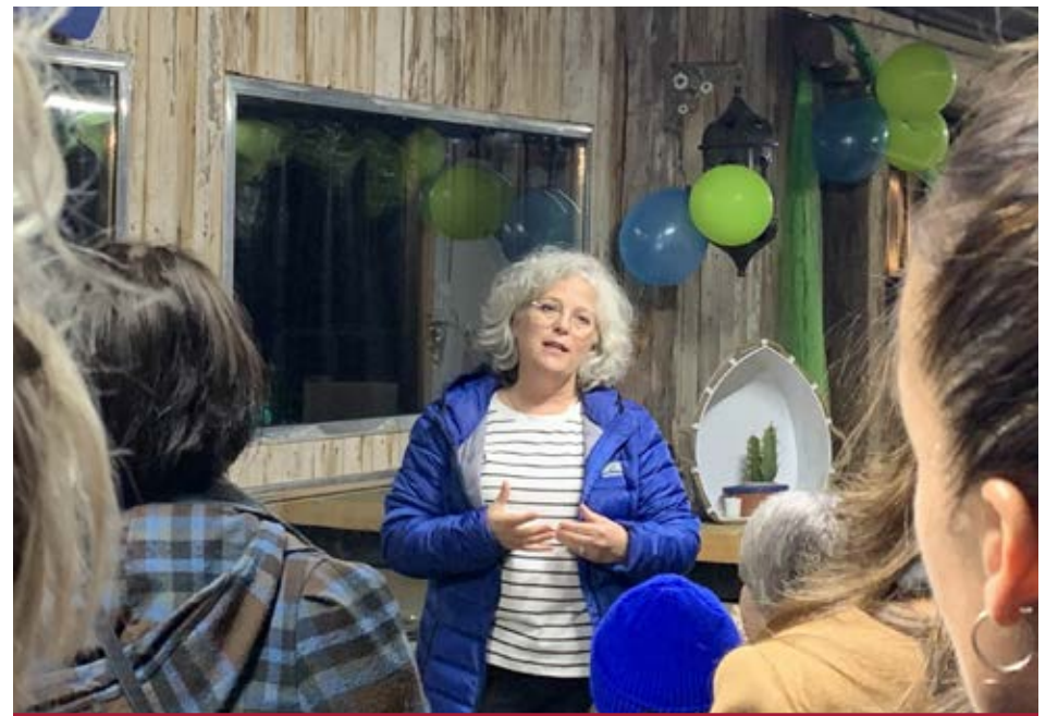
Lors de la tournée d'entreprises à l'île d'Orléans, les congressistes ont notamment visité Du Capitaine Ferme-Vinaigrerie-Distillerie.

En 2022, la clientèle des entreprises agrotouristiques de la région de Québec comptait 54 % de visiteurs locaux, résidant à 40 km et moins de l'île.