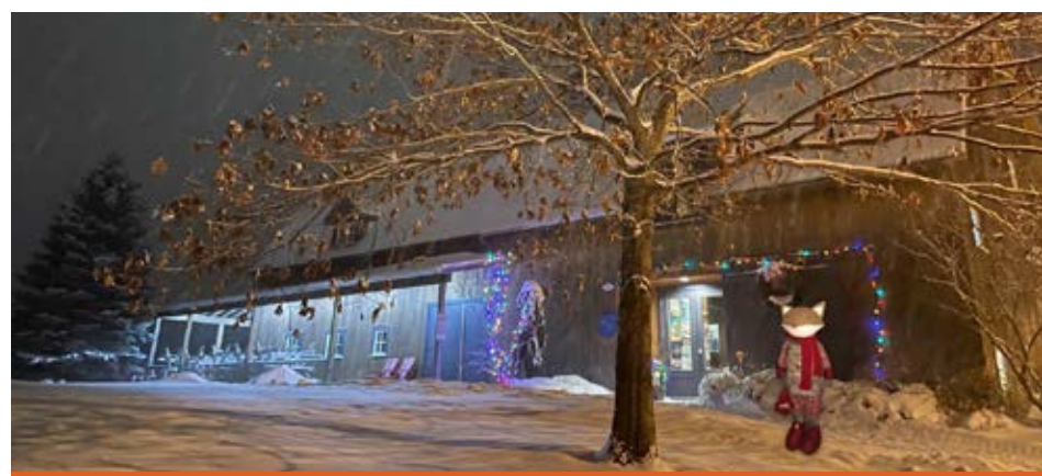
Le représentant officiel du Marché de Noël de l'île d'Orléans, Léon, vous attend à l'Espace Félix-Leclerc, du 1 er au 3 décembre.