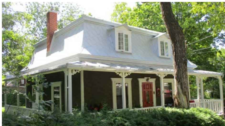
Exemple de maison mansardée.

Nous nous retrouverons le mois prochain pour explorer plus en détail les caractéristiques du site patrimonial de l'Île d'Orléans ainsi que deux autres styles d'immeubles, plus contemporains, qui ont été érigés sur le territoire, soit la maison vernaculaire industrielle et la maison Boomtown.