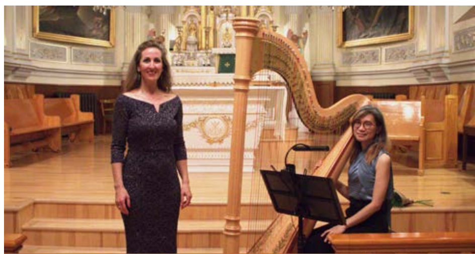
Le Duo Fleur d'Ange lors du concert-bénéfice du Manoir Mauvide-Genest, © Sarah Thibaut-Cormier le 8 octobre dernier.