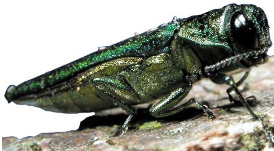
L'agrile du frêne est un insecte envahissant qui s'attaque aux essences de frêne.

Gouvernement du Canada: https://inspection.canada.ca/protection-des-vegetaux/especes-envahissantes/insectes/agrile-du-frêne/fra/1337273882117/1337273975030