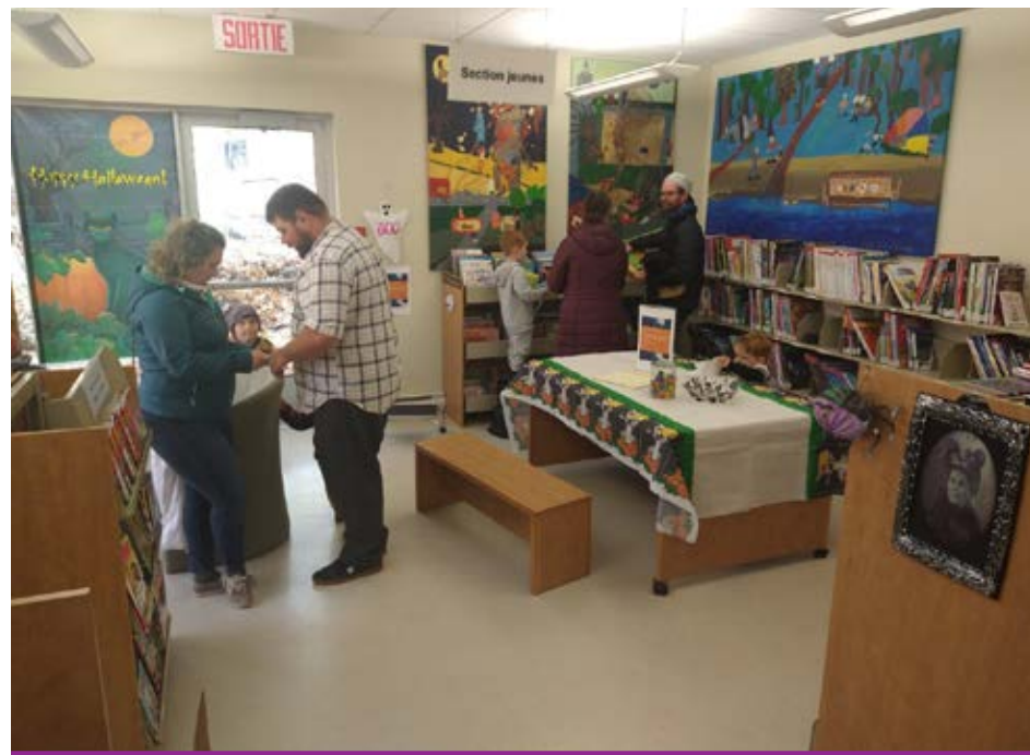
Des activités avaient été organisées à la bibliothèque David-Gosselin dans le cadre de l'Halloween.