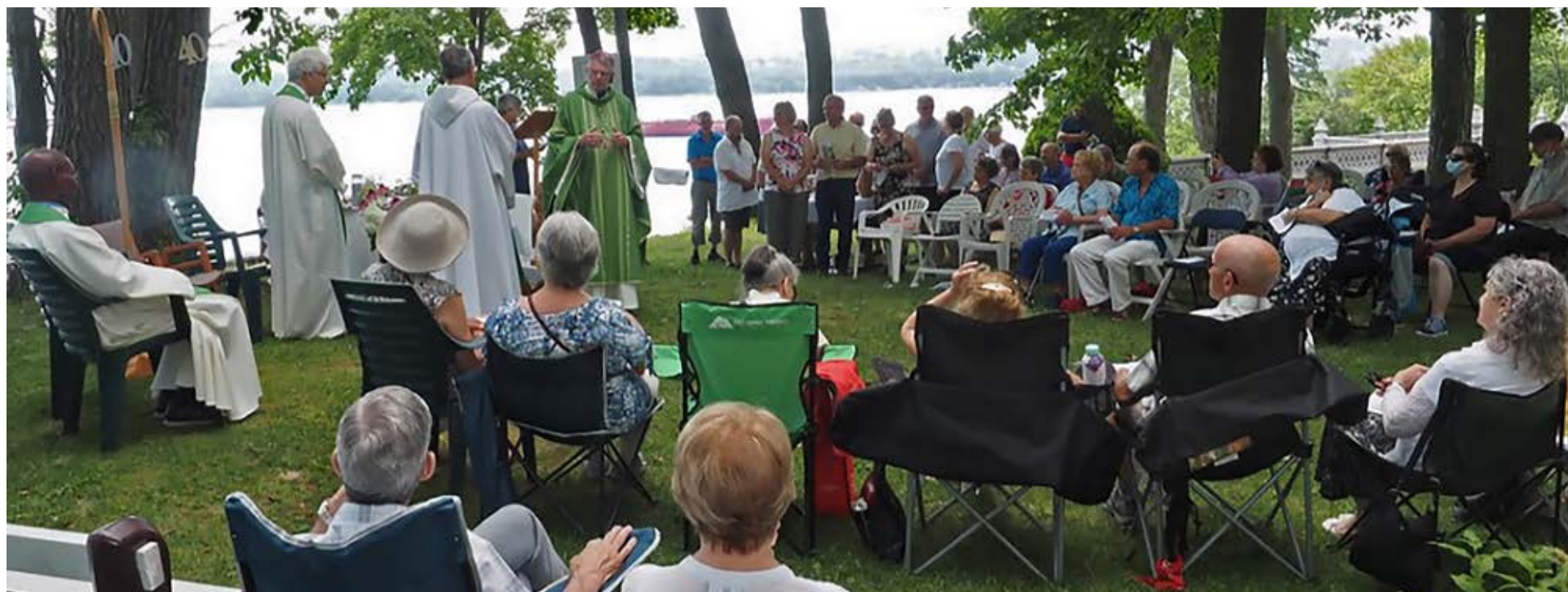
La célébration eucharistique s'est déroulée sur le terrain du Foyer de Charité.

Pour plus de renseignements: www.foyerndo.com