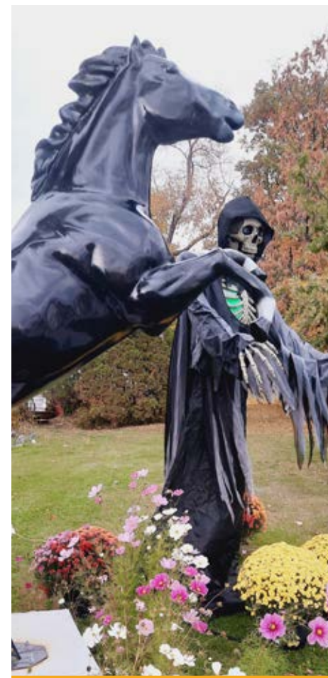
Le cheval noir est situé près de la Maison de l'île, à Saint-Jean.

N'hésitez pas à m'écrire à lamaison-delile1900@gmail.com