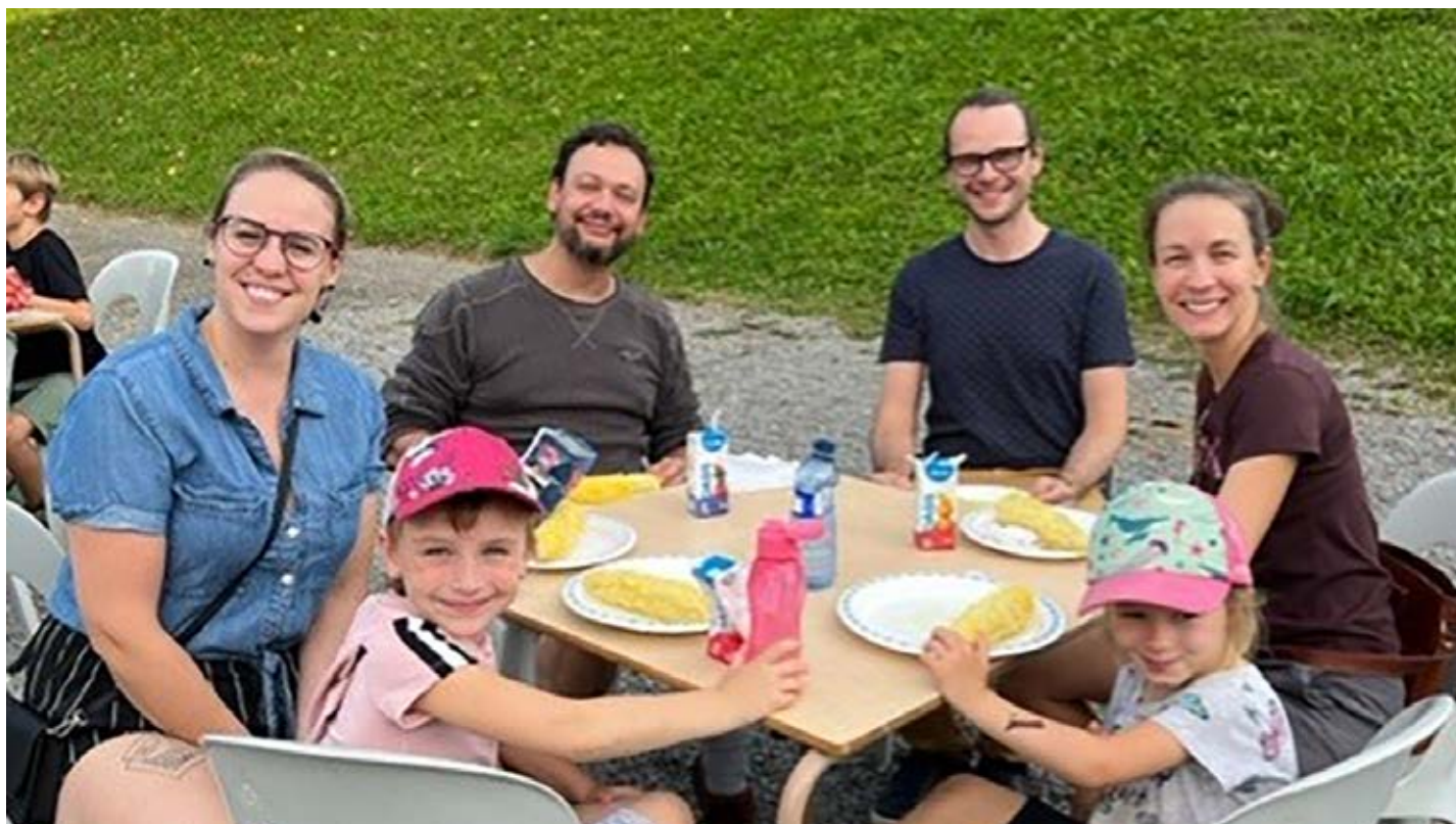
Des parents du bâtiment de Sainte-Famille ont pris part à la rentrée scolaire de 2022.