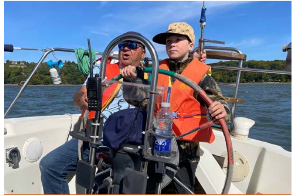
Des jeunes ont pu conduire un voilier.