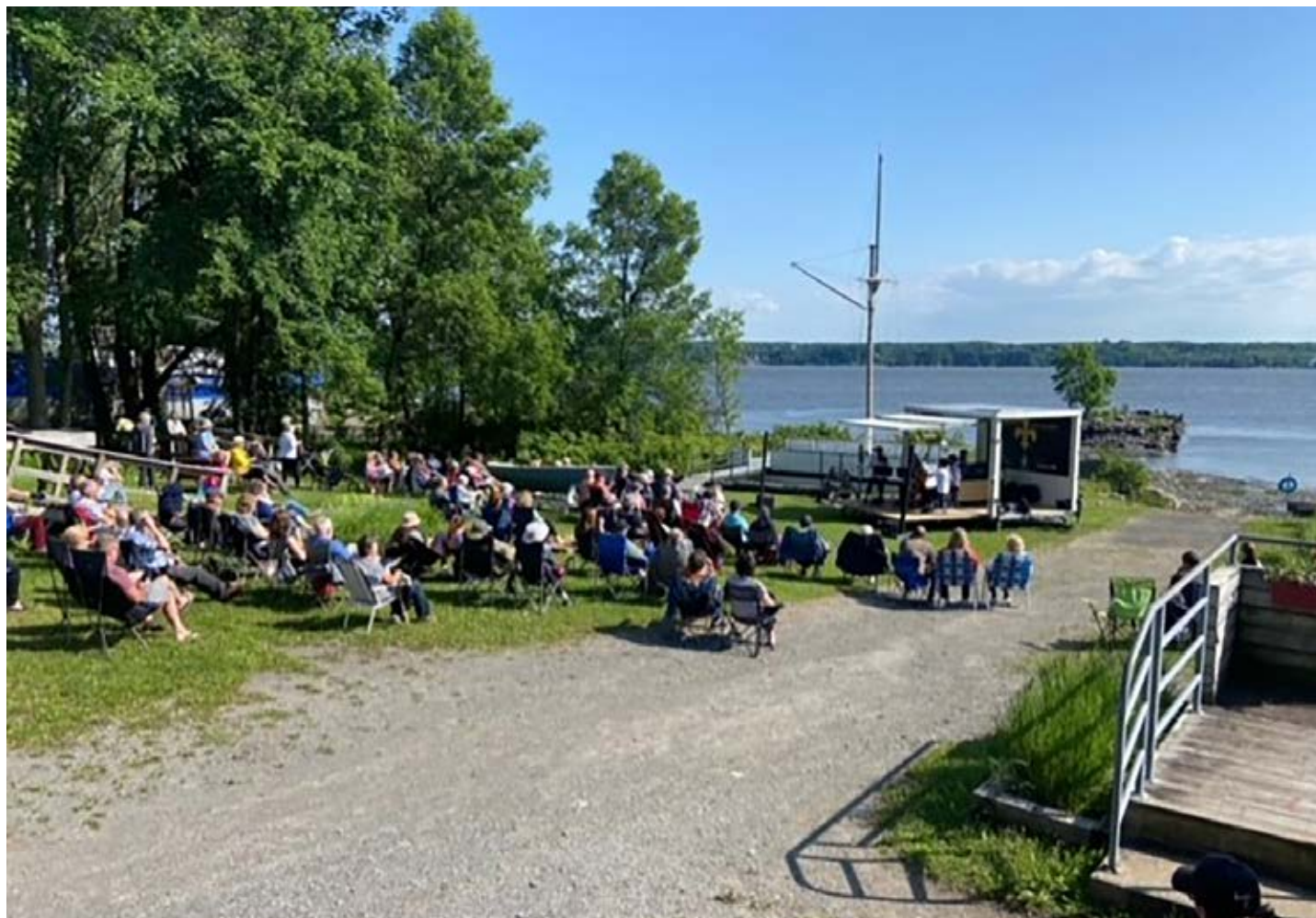
Le concert Notre fleuve, notre musique du 21 juin dernier a fait le bonheur de plusieurs personnes.

Pour obtenir des informations sur le Parc maritime : 418 828-9673 ou www.parcmaritime.ca