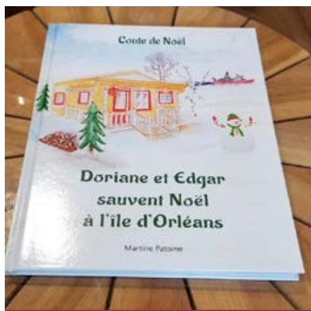
Le conte de Noël de Martine Patoine est en vente à la Maisonnnette de l'île.

Le second conte est illustré par sept artistes de Lévis, par sa fille et par l'aquarelliste Carl Coulombe, de Sainte-Pétronille.