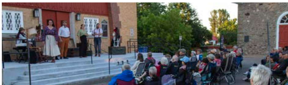
Quelque 500 personnes ont assisté aux trois prestations.

Ce projet a été réalisé grâce au soutien financier du gouvernement du Québec et de la MRC de L'Île-d'Orléans dans le cadre de l'Entente de développement culturel.