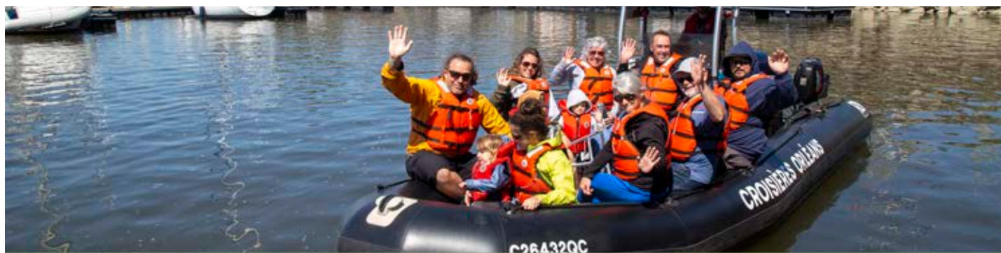
Les tours en zodiac de Croisières Orléans faisaient partie des activités proposées lors de la Fête du nautisme.

La Garde côtière auxiliaire (CGA) s'est jointe à la fête avec un atelier sur la sécurité en embarcation. Il a notamment été possible d'apprendre que la CGA compte 750 sauveteurs bénévoles répartis dans 65 unités au Québec. Chaque année, ils réalisent des centaines d'interventions sur les voies navigables de la province. Participant à de nombreuses formations, ils concentrent leurs actions sur la prévention.