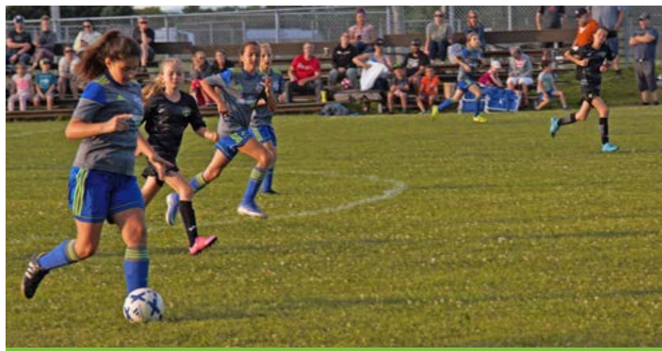
L'Impérial U11 féminin en action au terrain de Saint-Pierre, le 6 juillet, face au CS Trident de L'Ancienne-Lorette.

Poursuivant un partenariat avec l'Académie de soccer Pro-Foot, qui consiste à prendre part à des entraînements optionnels, l'ASDPS offre des séances privées avec entraîneur.