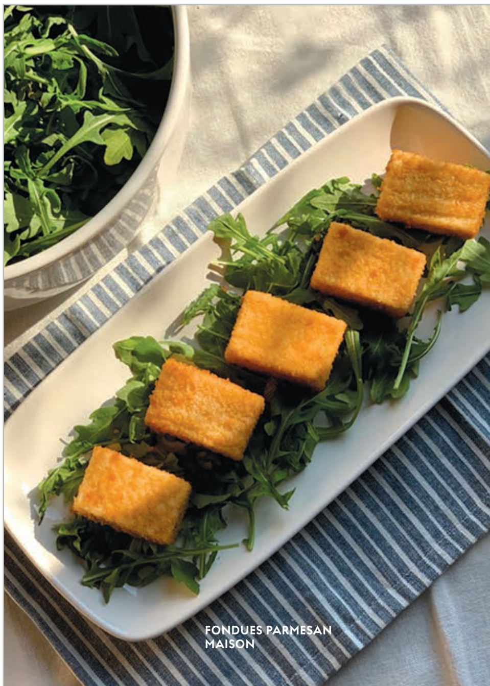
FONDUES PARMESAN MAISON

Pour en savoir plus et se procurer des billets: Spectacles | Espace Félix-Leclerc ( felixleclerc.com )