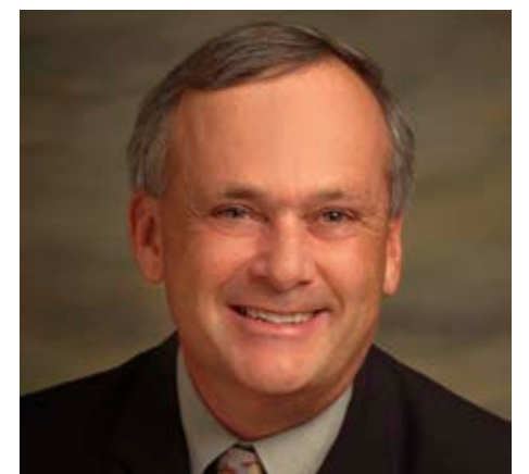
Harold Noël © Caisse Desjardins de L'Île-d'Orléans