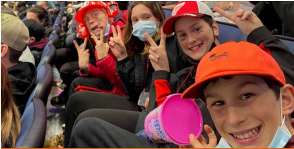
Il y avait de l'ambiance au match des Remparts!

Si vous avez des questions ou commentaires, vous pouvez nous joindre via notre profil Facebook (MDJ île d'Orléans) ou par courriel à info@mdjio.com . Il nous fera plaisir de vous répondre!