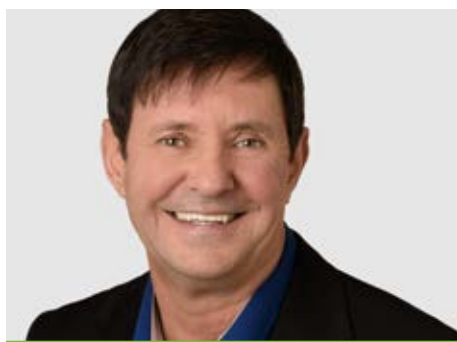
Michel Racine © Caisse Desjardins de L'Île-d'Orléans