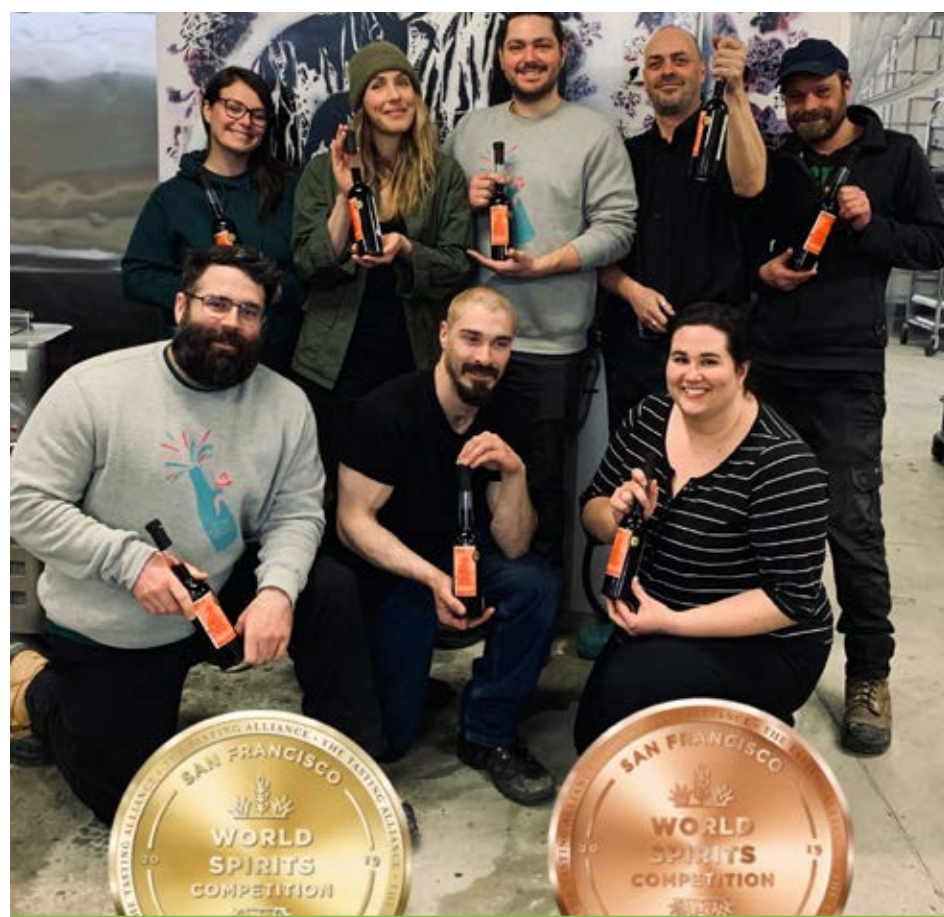
L'équipe de production de Cassis Monna &amp; Filles avec les deux médailles remportées à San Francisco.

La superficie où est cultivé le cassis se déploie sur 22 hectares et pourrait bientôt s'étendre davantage. Le domaine produit plus de 60 000 bouteilles par année.