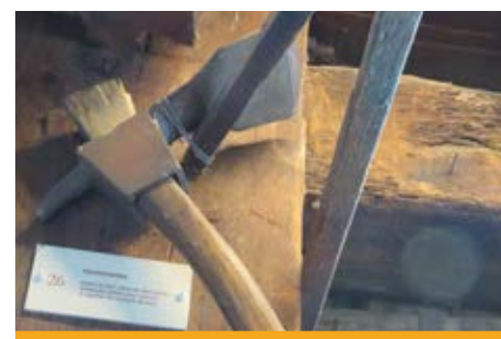
L'herminette est un outil de précision qui pare, dresse et délarde le bois.