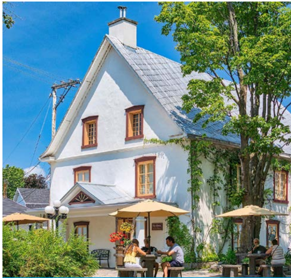
La Chocolaterie de l'Île d'Orléans constitue un endroit très fréquenté par les touristes.

Géré par la MRC de L'Île-d'Orléans, le BAT a pu voir le jour grâce à l'abbé Raymond Létourneau qui avait fait une demande de permis en 1977.