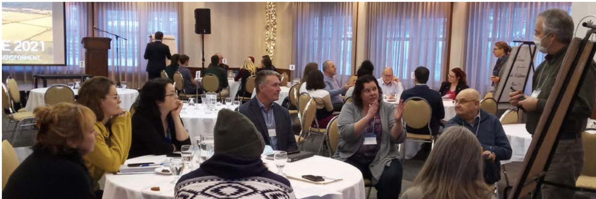
Des ateliers visant la valorisation des paysages ont fait partie de la journée Événement Paysages.