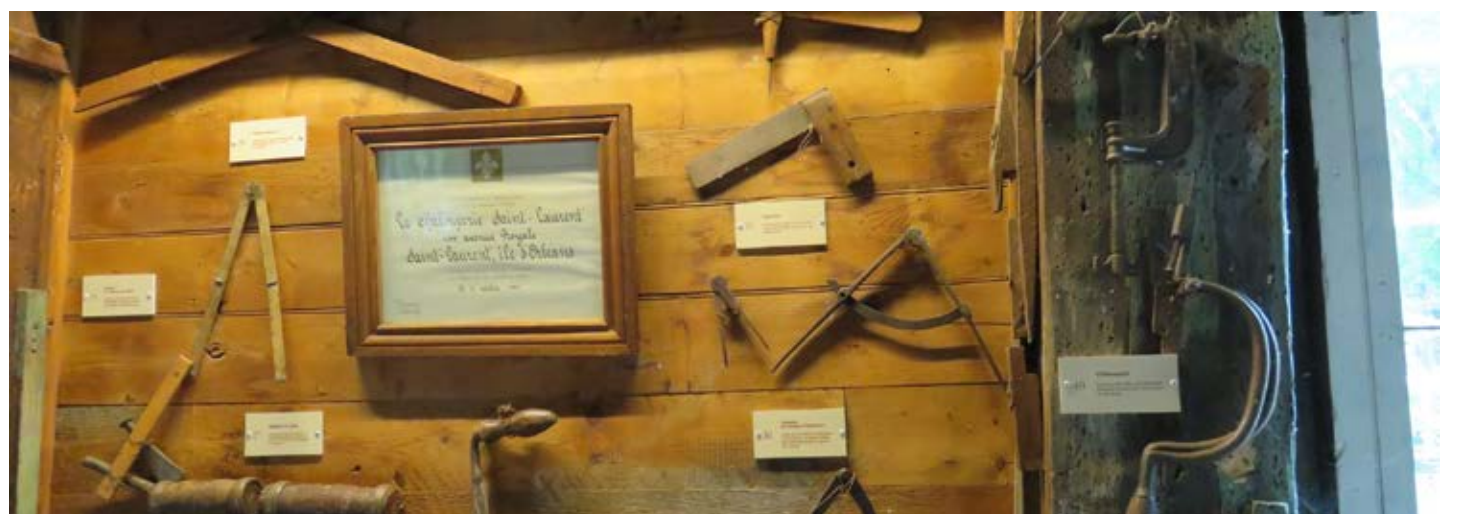
Ce qui constitue la particularité de la chalouperie Godbout est le fait que les outils se trouvent in situ (sur place), ce qui en assure non seulement l'authenticité, mais nous plonge dans une immersion complète où il est facile d'imaginer le travail des chaloupiers.

Bibliographie - Françoise DUBÉ, Bernard GENEST, La chalouperie Godbout , dossier no 19, ministère des Affaires culturelles, Direction générale du Patrimoine, Service de l'Inventaire des Biens culturels, Bibliothèque nationale du Québec, mars 1976.