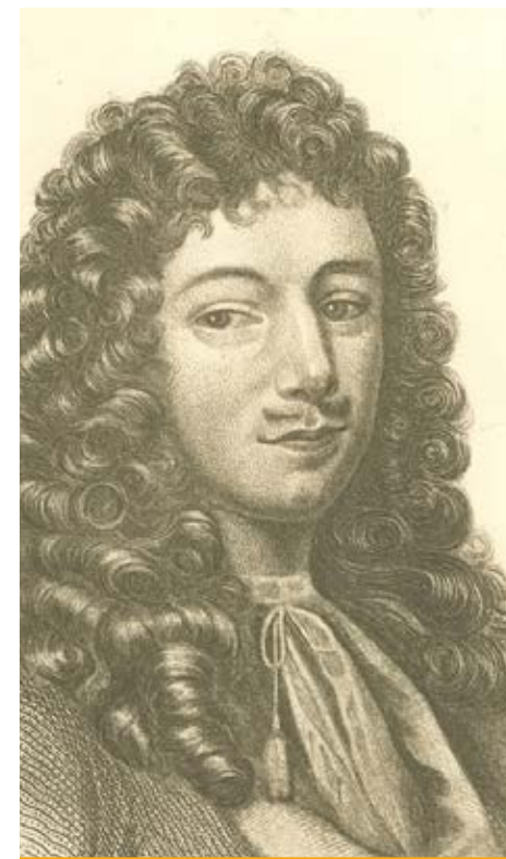
Jean Talon, premier intendant en Nouvelle-France, de 1665 à 1670.

Au plaisir de vous retrouver à l'automne 2022 !