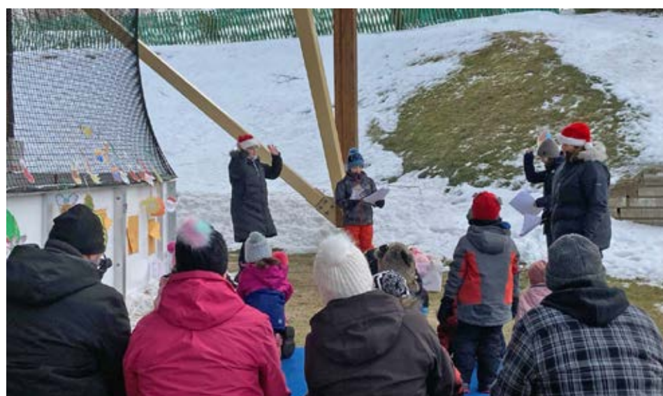
L'Heure du conte a attiré une douzaine de jeunes et plusieurs parents, le 18 décembre.