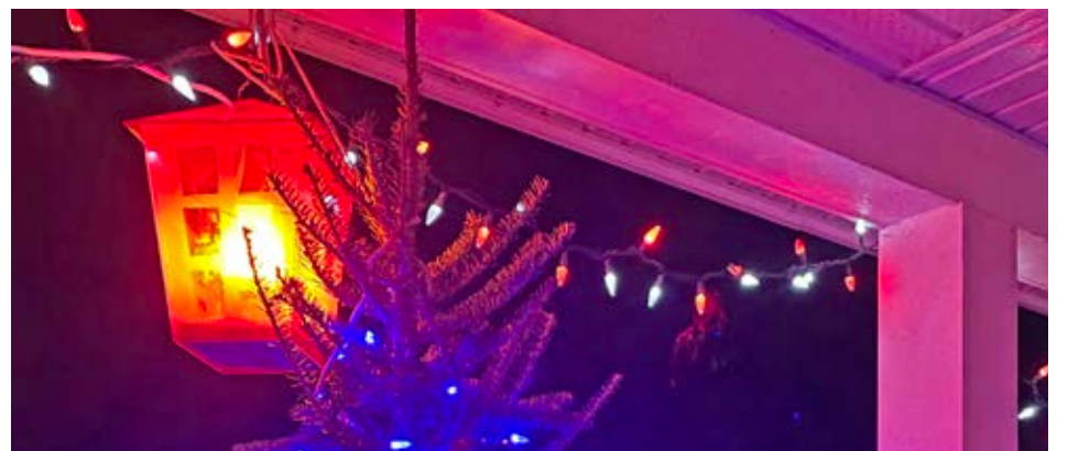
Une des 45 petites lanternes ayant illuminé Saint-Jean, à Noël.

Sandrine Reix et Claire Beaumont pour le comité d'embellissement