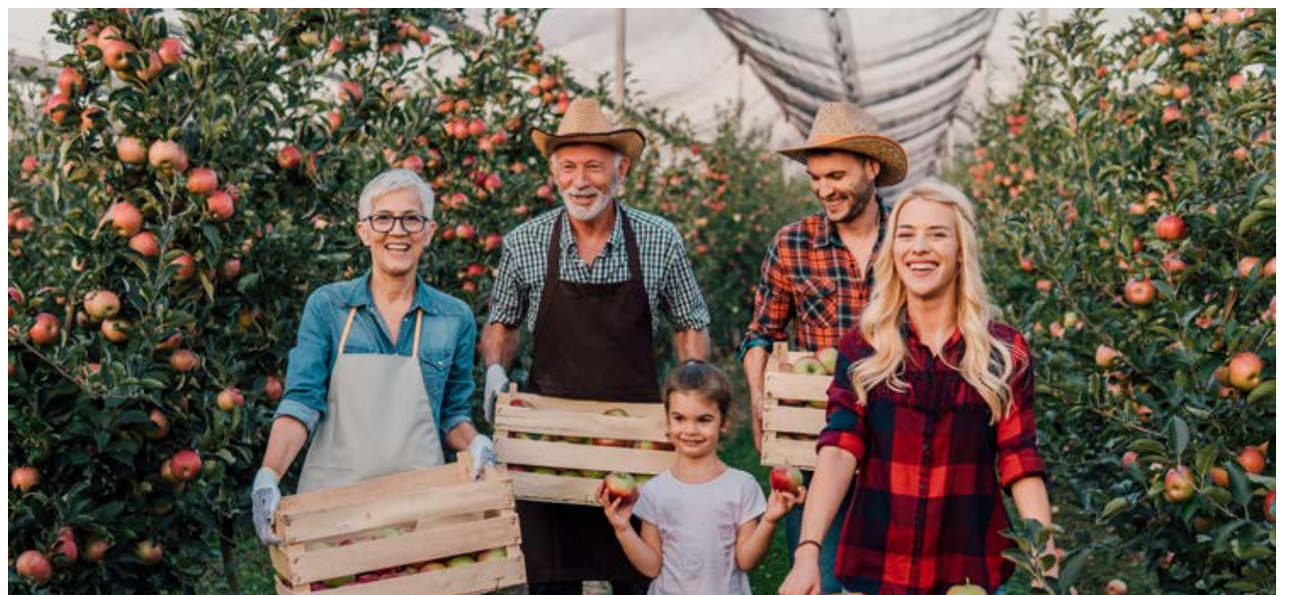
La Caisse Desjardins de L'Île-d'Orléans, engagée dans les projets d'ici.