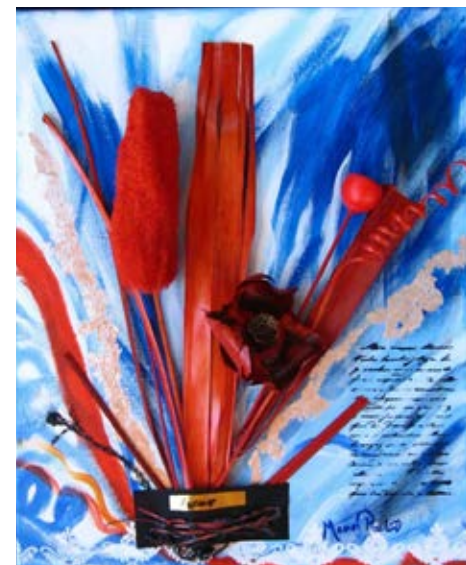
L'exposition des œuvres de Manon Pouliot se poursuit jusqu'à la fin mars. © Manon Pouliot