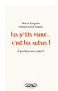
Édition Michel Lafon