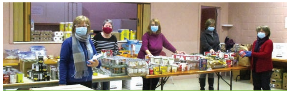
Depuis le début de la pandémie, des bénévoles de l'ABIO œuvrent au service d'aide alimentaire d'urgence.

Pour informations : 418 828-1586 ou abiorleans.ca