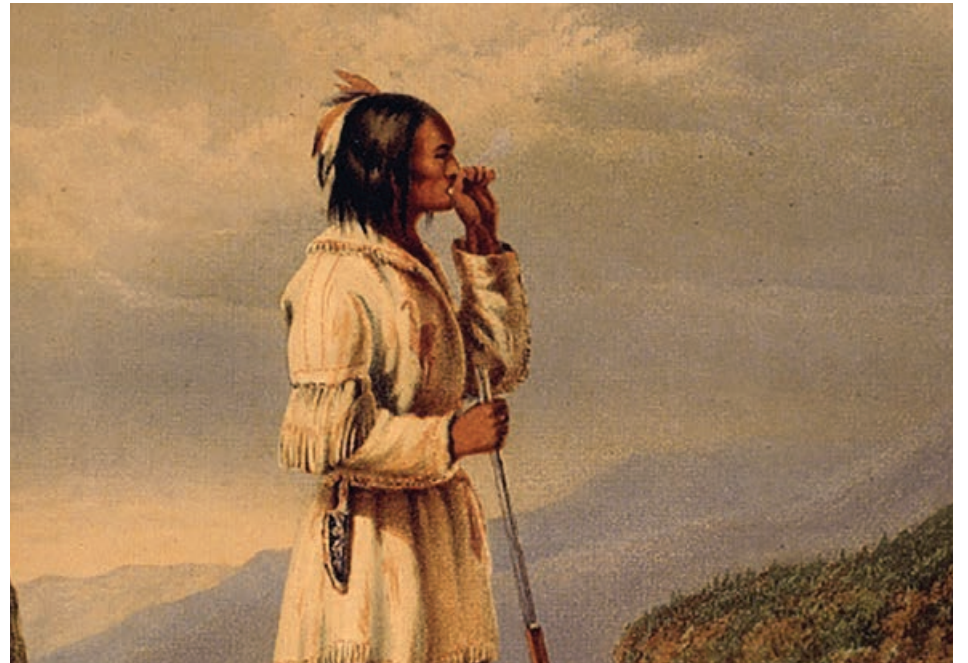
Un chasseur huron-wendat appelant l'original. Artiste: Cornelius Krieghoff, vers 1868. © Musée McCord

Que vous preniez le temps de lire un livre ou de vous rendre à l'événement Kwe! qui aura lieu du 18 juin au 4 juillet, plusieurs avenues s'offrent à vous pour vous plonger dans la culture des Premières Nations. Bonne découverte!