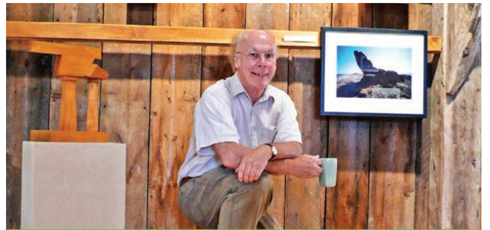
Le projet sera géré par Arthur Plumpton, consultant en restauration et réhabilitation du patrimoine bâti agricole.

Le programme sera détaillé davantage en juillet.