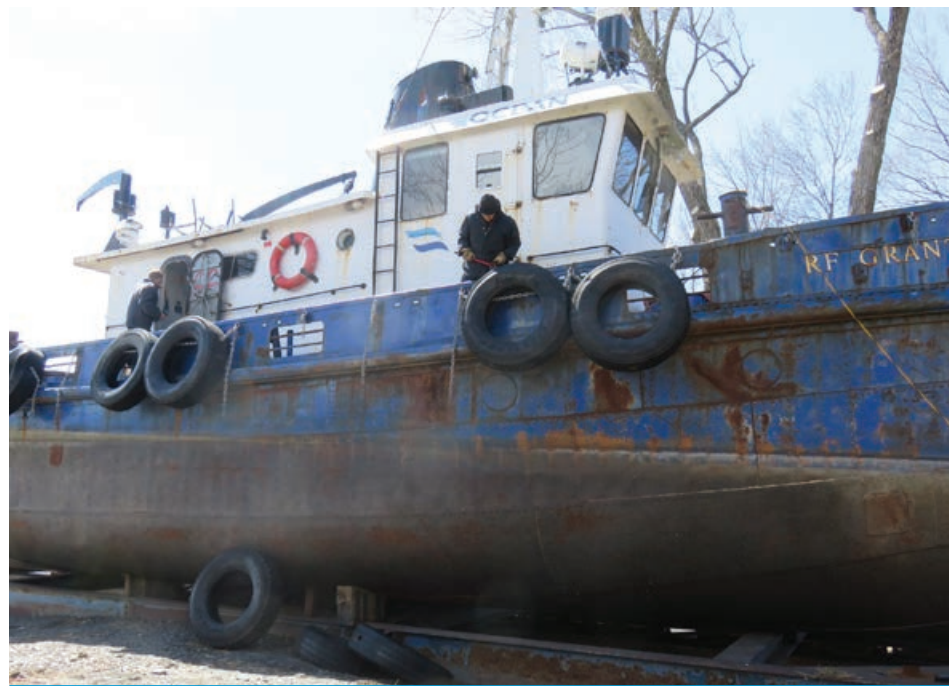
Trois pneus sont conservés de chaque côté du navire afin d'en garder le caractère de remorqueur.

atteindre une vitesse de 11 nœuds et son port d'immatriculation est Montréal.