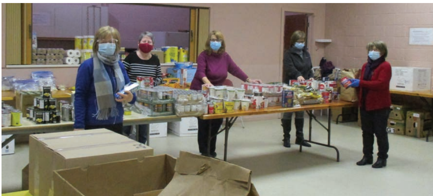
Des bénévoles en action lors de la distribution des paniers de Noël.

L'ABIO désire remercier tout particulièrement la trentaine de volontaires qui ont accepté de nous accorder de leur temps et de « mettre la main à la pâte » dans la coordination des tâches, la cueillette et le transport des boîtes, le montage des paniers, l'accueil des gens de même que la confection de mets cuisinés. Ils ont ainsi contribué au succès de cette activité.