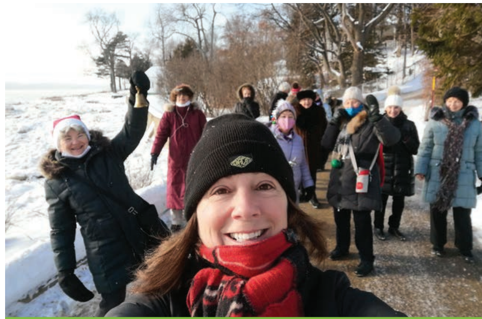
La bonne humeur régnait à la pointe de Sainte-Pétronille en ce début de nouvelle année.