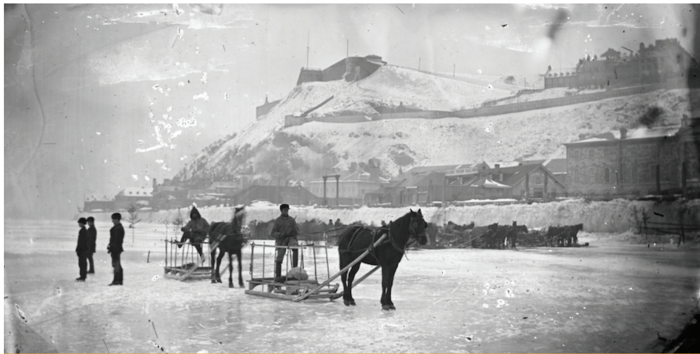
Charretier en attente sur le fleuve devant Québec.

Nos ancêtres se sont adaptés aux hivers rudes et froids avec force et résilience. Aujourd'hui, nous avons le luxe de jouir de cette saison hivernale dans la chaleur de nos activités et de nos foyers. Profitons de cette saison dite morte pour vivre pleinement la frénésie de l'hiver!