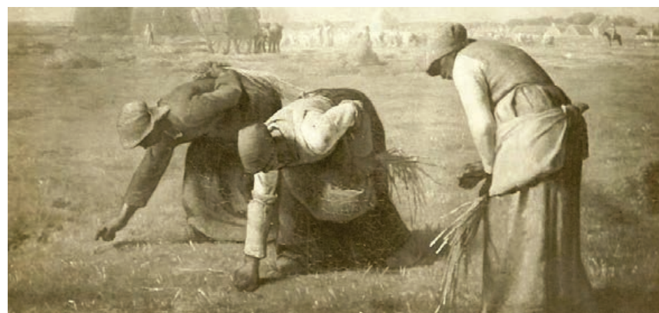
Exemple de glaneuse.

Merci à tous et on continue. Ainsi on va tous devenir des glaneurs des temps modernes, issus de la tradition d'entraide agricole. En complément d'inspiration, je suggère le très beau film d'Agnès Varda «Les Glaneurs et la Glaneuse».