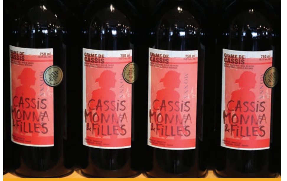
La vedette du domaine est la crème de cassis, un produit qui, année après année, remporte des médailles et des prix au niveau mondial.

Pour écouter les entrevues réalisées chez Cassis Monna & Filles, allez sur ma chaîne La Beauté du Vin , sur YouTube, www.labeauteduvin.com