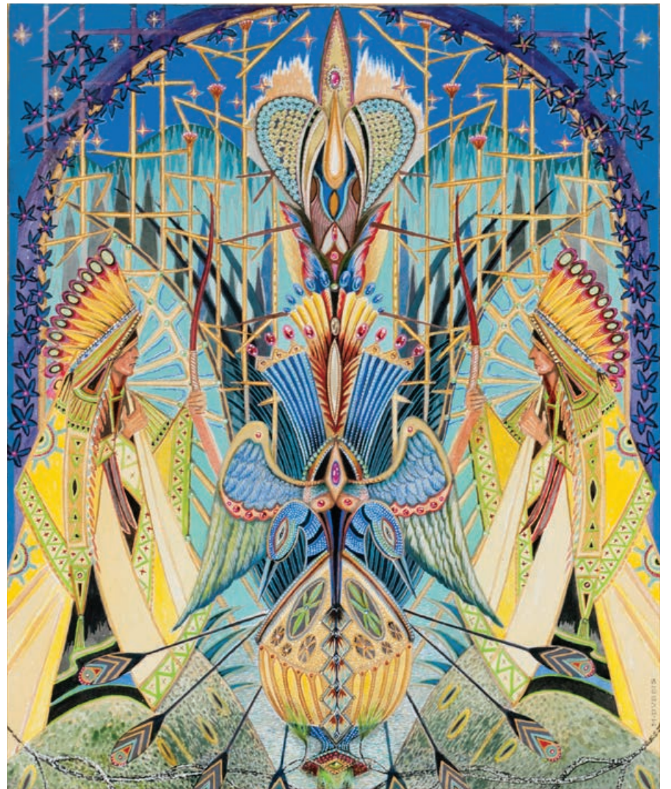
Oeuvre de Marius Dubois datant de 2004 et intitulée Le totem .

Nous invitons donc les lecteurs et lectrices à se rendre sur le site qui se veut une nouvelle fenêtre ouverte sur les voyages de l'imaginaire.