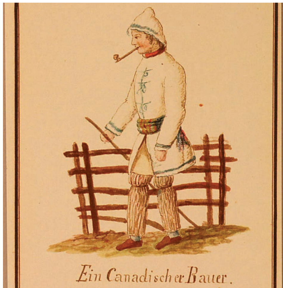
Un paysan canadien-français en habit d'époque.

Et maintenant, transformons-nous en oignon et profitons de notre hiver !