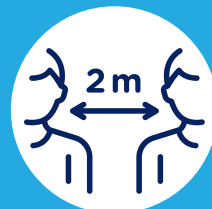
Gardez vos distances