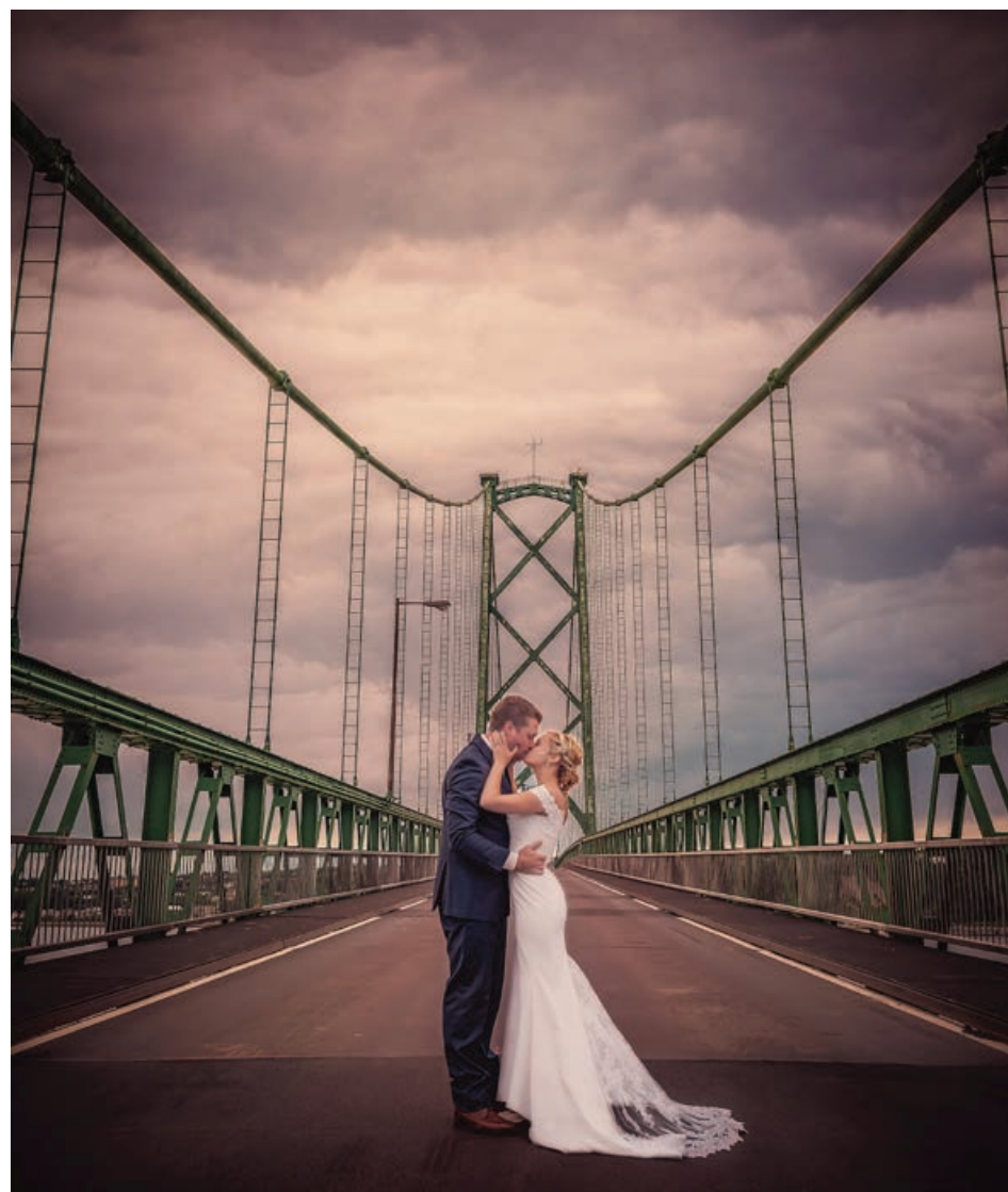
Sa vidéo des mariés sur le pont de l'île compte plus de 100 000 vues.

Pour en savoir plus sur l'artiste : https://sebaztiengirard.com/portfolio