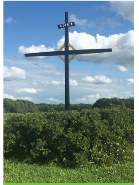
Cette nouvelle croix de cèdre est située à Sainte-Pétronille.

En ces temps où l'obsession du présent entraîne un désintérêt à l'égard du passé, où l'on s'adonne avec passion à une sorte de brassage des valeurs, voire à des opérations de déboulonnage, les croix de chemin murmurent discrètement au passant: Souviens-toi .