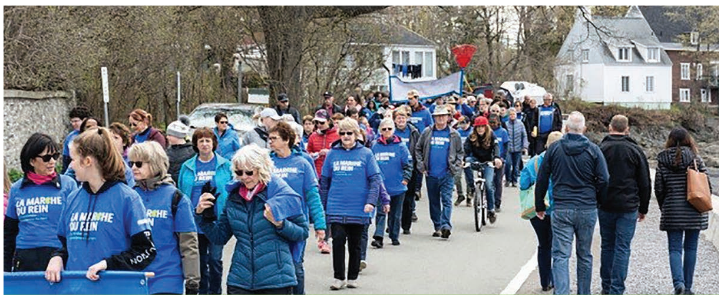
L'an passé, malgré la pluie qui menaçait de tomber, plus de 140 personnes étaient venues marcher.

Cette 4 e édition de la Marche du rein de l'île d'Orléans sera dédiée à tou(te)s mes ami(e)s dialysé(e)s qui se battent à mes côtés ainsi qu'aux patient(e)s greffé(e)s et aux personnels de soins de santé.