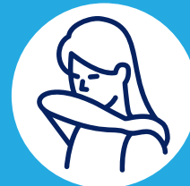
Toussez dans votre coude

Le port du masque est obligatoire lors d'une consultation.