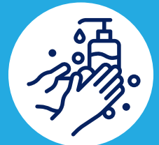
Lavez vos mains