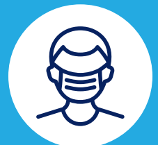
Portez un masque