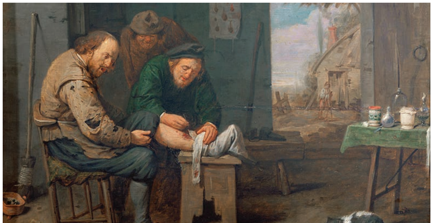
Ryckaert III, David. Le chirurgien. 1638. Huile sur bois. Musée des Beaux-Arts, Valenciennes, France.

J'en profite pour souligner l'excellent travail du personnel soignant de notre époque ! Merci !