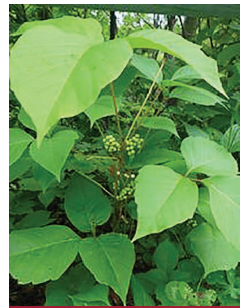
Herbe à la puce

Vous pouvez également consulter un conseiller dans un centre jardin pour connaître les produits les mieux adaptés permettant d'empêcher l'herbe à poux de pousser sur votre terrain.