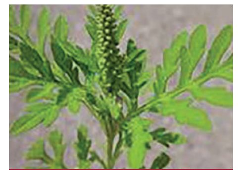
Herbe à poux