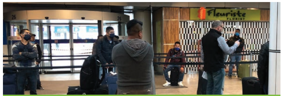
Des travailleurs mexicains à leur arrivée à Dorval.

La Ferme Onésime Pouliot est l'un des actionnaires de Petits Fruits Orléans, un des plus grands regroupements de producteurs pour la mise en marché des fraises au Canada.