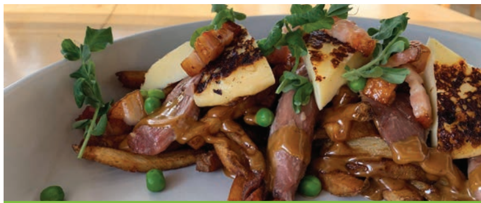
La poutine L'Insulaire de La Goéliche.

La Semaine de la poutine s'est aussi donné une vocation caritative puisque pour chaque poutine vendue, 1 $ est remis à la Fondation Rêves d'enfants.