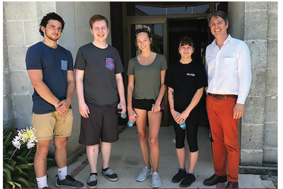
De jeunes Orléanais ont apprécié leur expérience en France par le passé.