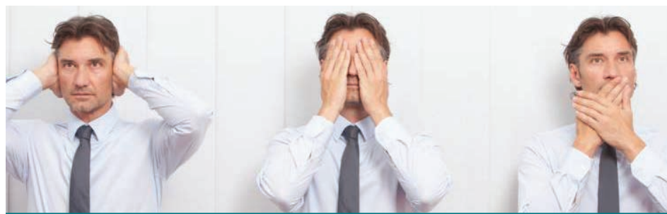
Au travail, de telles situations se produisent souvent, des non-dits entre collègues ou de la part de la direction.

Selon le dictionnaire L'Internaute: «Un non-dit désigne quelque chose qui n'est pas exprimé, qui est caché ou implicite dans le discours d'un individu.»