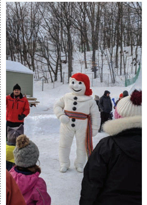
La visite de Bonhomme Carnaval a fait un tabac lors du Plaisir des neiges.

Quelque 120 personnes ont pris part à la 9 e édition du Plaisir des neiges, le 26 janvier, en après-midi, au terrain des loisirs de Saint-Laurent-de-l'Île-d'Orléans. Organisé par la municipalité, l'événement de plein air proposait des activités telles que sculpture sur neige, glissade, patin, visite de Bonhomme Carnaval et jeu gonflable. Ces deux dernières activités sont celles qui ont connu le plus de succès. Pouvant compter sur l'appui de quatre bénévoles, Plaisir des neiges sera répété l'hiver prochain.