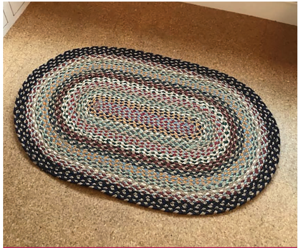
Les tapis de forme ovale correspondent à l'embrasure des maisons.

sur une clôture, aux bras de galerie, sur une corde de bois ou tout simplement sur l'herbe.