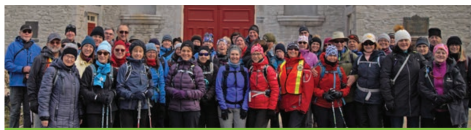
Les marcheurs se sont réunis devant l'église de Sainte-Famille avant leur départ pour la route du Mitan.

Depuis 2013, les chemins de Compostelle attirent plus de 200 000 pèlerins chaque année, avec un taux de croissance de plus de 10% par an. Les pèlerins viennent essentiellement à pied et souvent de villes proches (demandant peu de jours de marche) pour atteindre Santiago.