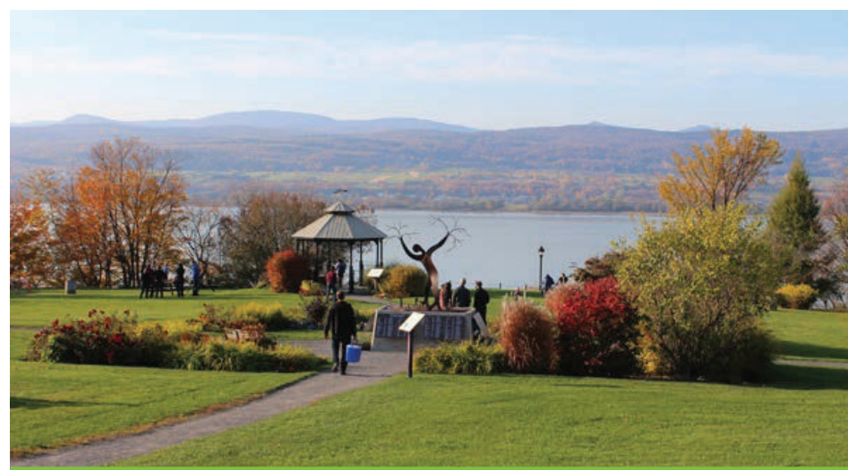
Les retombées économiques liées à la présence des paysages mentionnés sont étroitement reliées à l'augmentation de l'attractivité touristique.

L'Entente sur la mise en valeur et la protection des paysages de la région de la Capitale-Nationale a été renouvelée en 2019 par le biais d'une participation bonifiée jusqu'en 2022 des MRC de La Côte-de-Beaupré, Charlevoix, Charlevoix-Est, Portneuf et L'Île-d'Orléans, de la Communauté métropolitaine de Québec (CMQ), du Secrétariat à la Capitale-Nationale, de Tourisme Charlevoix et du ministère des Transports du Québec.