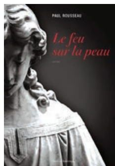
Éditions Québec Amérique