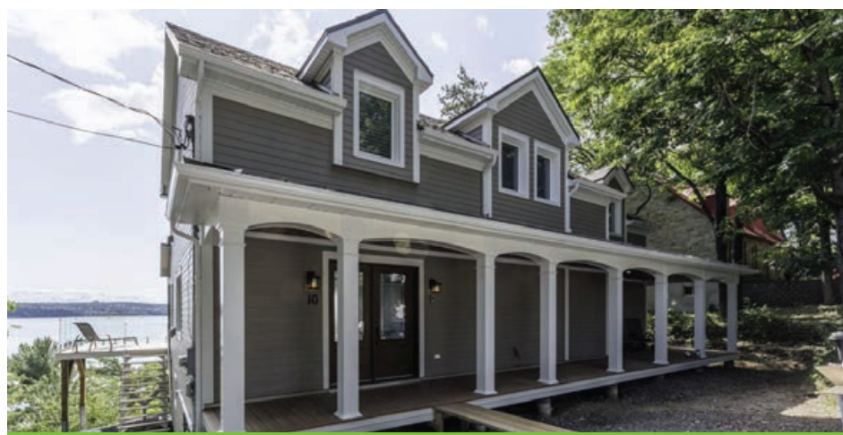
Le projet finaliste est situé à Sainte-Pétronille.

donné un triple mandat: représenter et défendre l'industrie, accroître le professionnalisme de ses membres et être un centre nerveux de promotion de l'industrie. L'APCHQ – région de Québec est reconnue pour ses initiatives telles que le salon Expo habitat Québec, l'attribution des Prix Nobilis et le répertoire en ligne TrouverUnEntrepreneur.com.