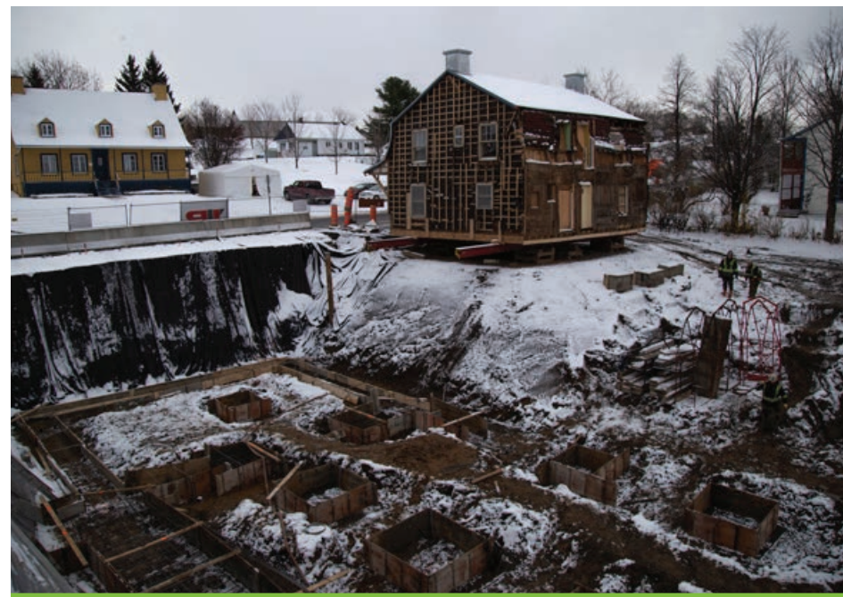
La construction du nouveau Pub Le Mitan et de la Microbrasserie de l'Île d'Orléans représente un important chantier, à Sainte-Famille.

Travaillant sur un rebranding, l'entreprise a décidé d'abandonner la bouteille de bière pour opter pour la canette.