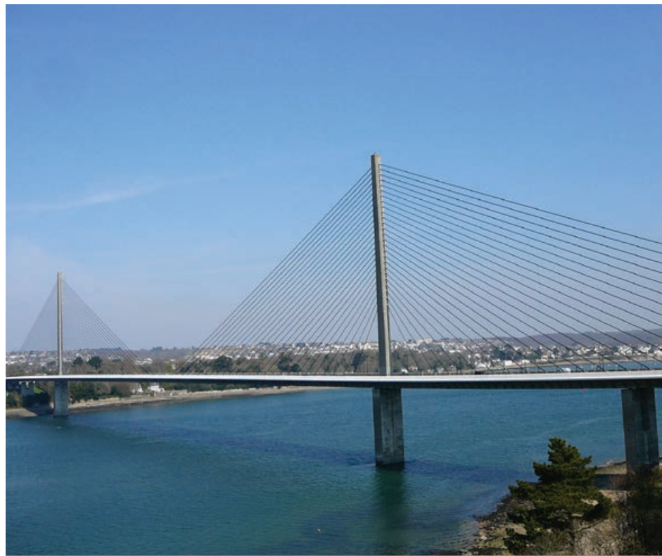
Voici à quoi pourrait ressembler le futur pont de l'île d'Orléans.

Les soumissions des entreprises sélectionnées devront être reçues par le MTQ avant le 25 novembre 2019. Ensuite, la sélection de la meilleure des trois propositions s'effectuera à l'été 2020. Enfin, le prestataire retenu commencera la préparation de l'avant-projet définitif en septembre 2020. Le dépôt de celui-ci est prévu à l'été 2021.