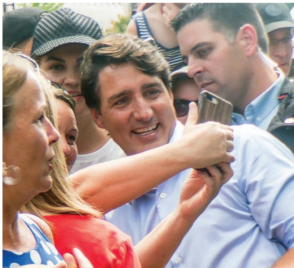
Le premier ministre du Canada, Justin Trudeau, fait figure de champion de l'auto-portrait puisqu'il se prête volontiers à ce jeu qui mise sur l'image.