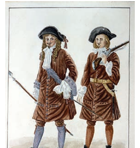
C'est en 1664 que le roi ordonne l'envoi des soldats du Régiment Carignan-Salière en Nouvelle-France pour aider à pacifier les Iroquois avec qui les habitants de la Nouvelle-France éprouvaient quelques conflits.

Pour en savoir plus sur l'histoire de ces familles qui se sont établies à l'île d'Orléans, visitez la Maison de nos Aïeux, centre d'histoire et de généalogie de l'île d'Orléans.