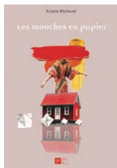
Éditions Québec Amérique