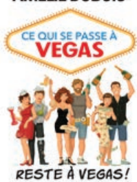
Les Éditions réunies