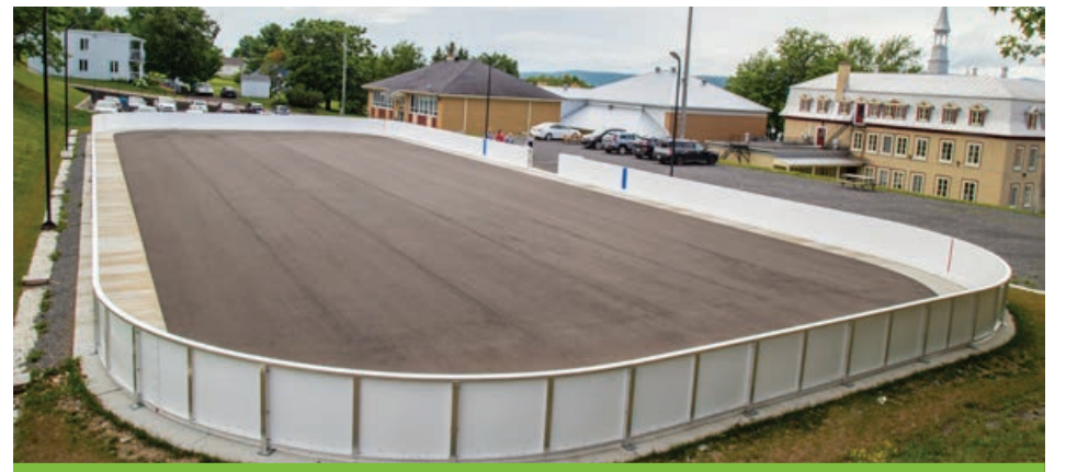
La patinoire de Sainte-Famille devrait être couverte pour l'hiver 2019-2020.

Il y a deux ans, la municipalité de Sainte-Pétronille a procédé à l'achat d'un terrain boisé propriété de la fabrique. Ce terrain est adjacent au terrain des loisirs actuels. 2019 marquera l'aménagement d'un circuit et la création d'un parc boisé. La municipalité entend également installer une surface multisport là où se trouvent actuellement les ronds de glace. Cette installation permettra la réalisation d'une variété d'activités sportives: patin, deck hockey, etc.