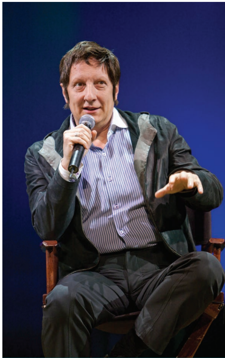
Robert Lepage a semé la polémique avec deux de ses productions théâtrales : SLĀV et Kanata.

à l'identité ou à l'expression du genre, à l'origine ou la race. Comment alors expliquer qu'il n'y a que pour la race que notre société a développé une telle sensibilité ? Dans notre univers télévisuel et théâtral un hétérosexuel peut jouer un gai, un homme une femme transgenre. On ne s'offusque pas non plus pour les handicapés. On vieillit ou rajeunit nos acteurs au besoin et on s'épate de leur performance lorsqu'ils adoptent de manière crédible un accent étranger. Pourtant le scandale n'est pas loin si on affuble un comédien de rastas. Est-ce bien ce que nous voulons ? Comme société, profitons de ce temps de repos avant la prochaine crise identitaire pour y réfléchir. Si on y met l'effort, peut-être que le sacrifice ne sera finalement plus en vain.