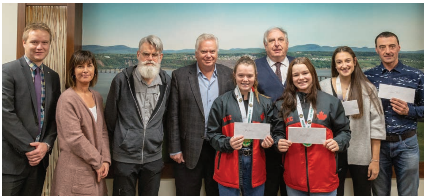
Chaque année l'organisation du tour de l'île à vélo remet des bourses à de jeunes sportifs et à des organismes jeunesse.

nouveau site internet. Pour plus de renseignements et pour les inscriptions, rendez-vous au www.challengesileorleans.com