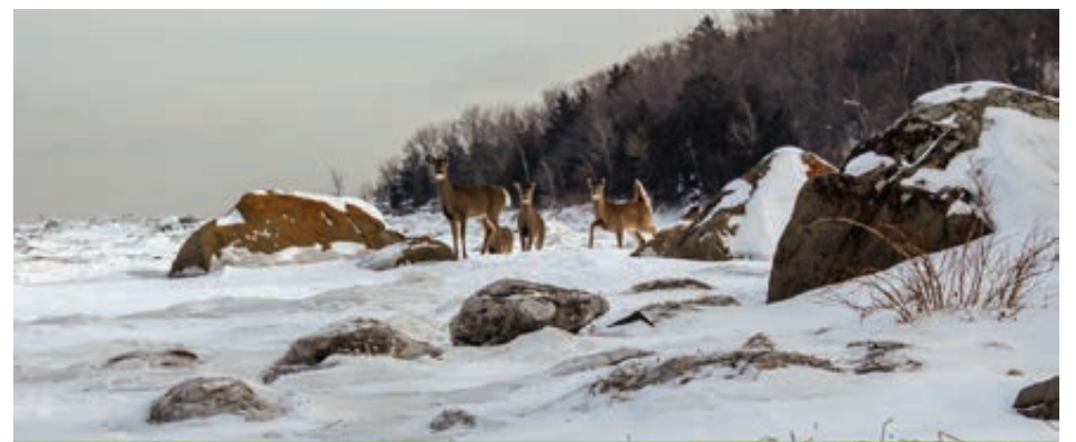
Selon la Coalition citoyenne pour la sauvegarde de la pointe d'Argentenay , le projet Huttopia mettra en péril la richesse naturelle du site. Sur la photo: un troupeau de chevreuils se déplaçant sur les berges du secteur.