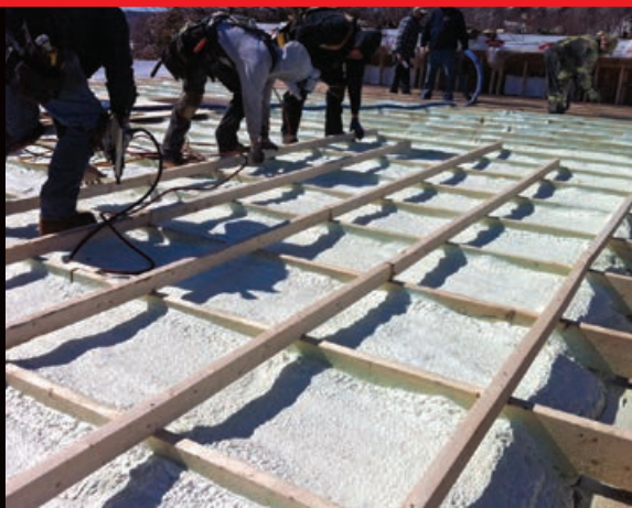
Projet d'isolation, Sainte-Anne-de-Beaupré