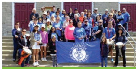
Les participants à la marche pour la Fondation canadienne du rein, qui avait lieu à Sainte-Pétronille.