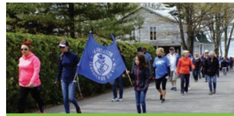
Des citoyens de Sainte-Pétronille ont marché en soutien à la Fondation canadienne du rein.