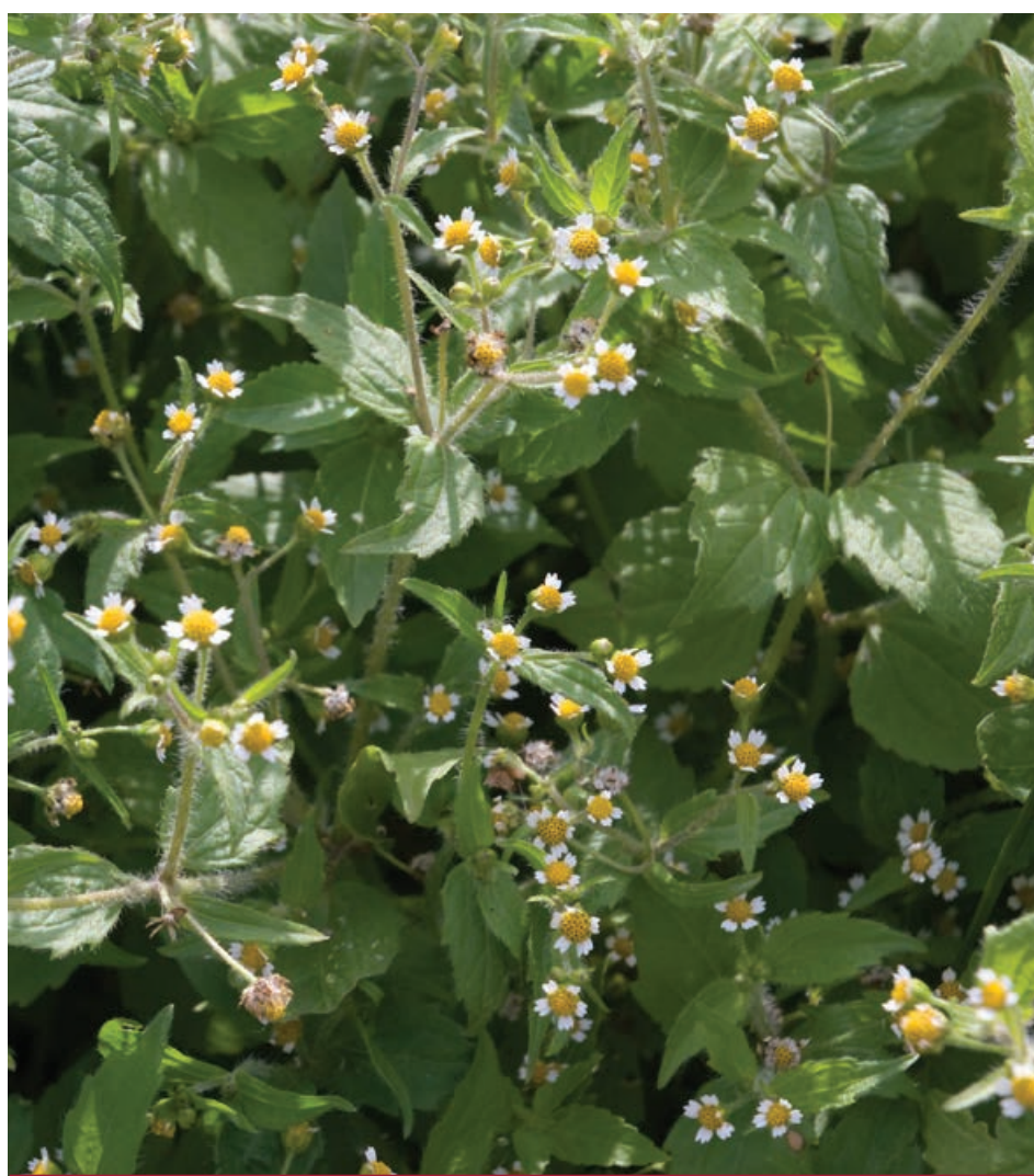
Les feuilles de galinsoga ont une saveur qui est proche de celle de l'artichaut ou du topinambour.