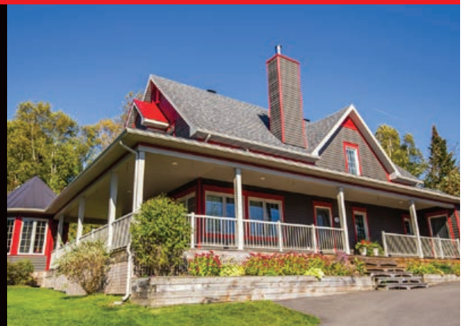
Projet mixte, bardeaux d'asphalte et tôle à vis non apparentes, Saint-Ferréol-les-Neiges

T. 418.702.0995 www.toituresrp.com RBQ. 5601-7338-01