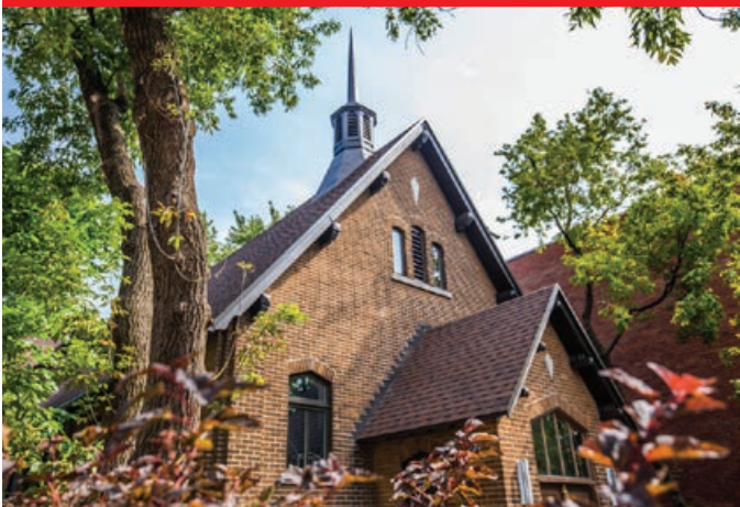
Bardeaux d'asphalte, Québec