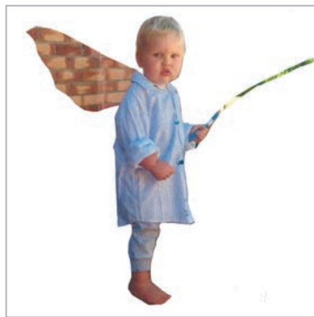
Détail de l'œuvre de C&C intitulée La pêche miraculeuse .

Tant les membres de la fabrique ainsi que les artistes espèrent pouvoir ouvrir l'église aux visiteurs le plus souvent possible durant l'été. Chose certaine, les artistes rencontreront les paroissiens le dimanche 8 juillet après la messe pour leur présenter les différentes œuvres et répondre à leurs questions. Ils demeureront sur place pour un après-midi portes ouvertes au cours duquel ils accueilleront les citoyens de l'île et leurs invités.