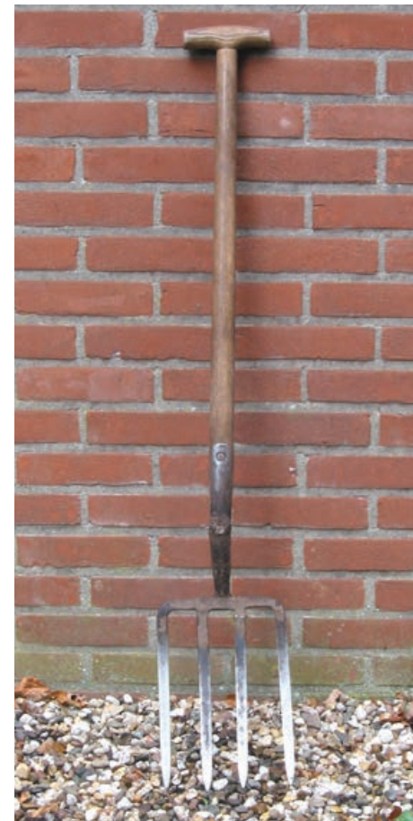
La fourche-bêche est l'outil idéal pour aérer le sol et éviter la germination de nouvelles mauvaises herbes.

En conclusion, pour moi, le désherbage c'est comme une forme de méditation qui me permet de prendre l'air et de faire le vide! Je ne pense à rien! C'est relaxant! En changeant votre façon de voir la chose, vous trouverez la tâche moins lourde! Bon jardinage!