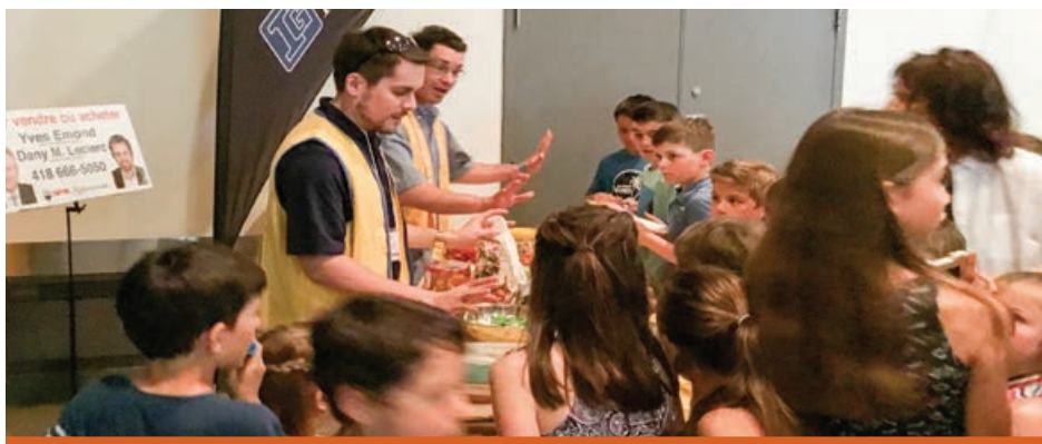
Lors du gala, les jeunes ont eu accès à un bar à bonbons.