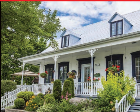
Tôle à la canadienne, L'Ange-Gardien