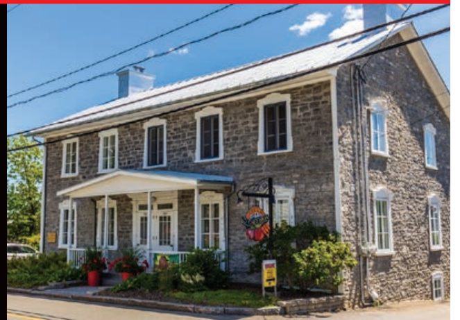
Tôle à baguettes, Château-Richer