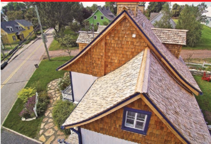
Projet de restauration (intérieur et extérieur), Saint-Jean-Île-d'Orléans