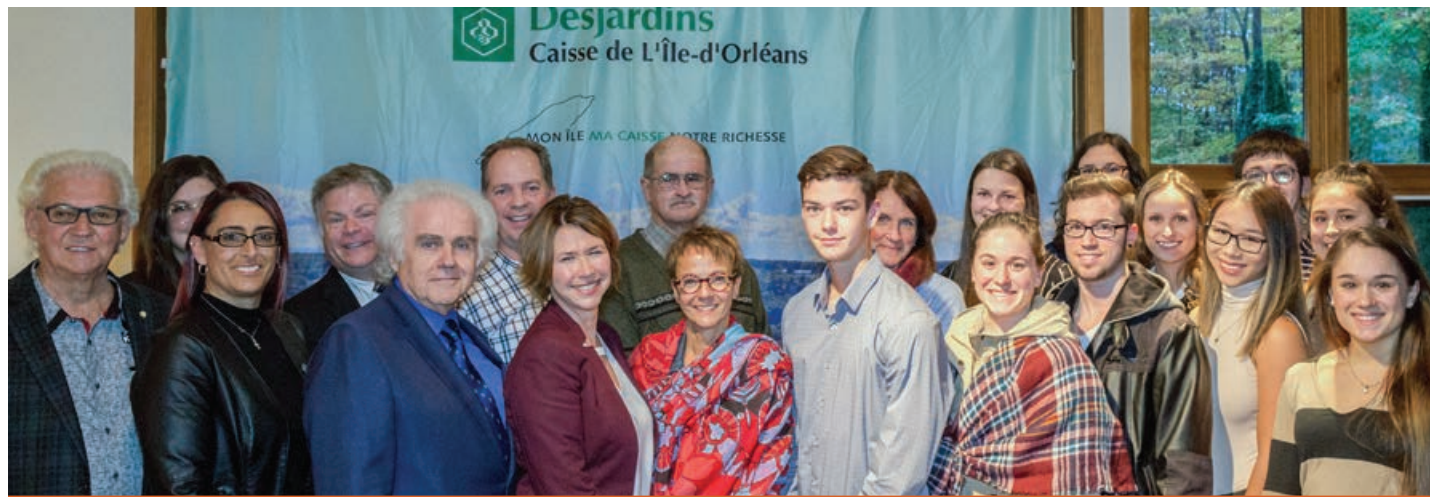
Outre quelques administrateurs, gestionnaires et membres du conseil de surveillance de la Caisse Desjardins de L'Île-d'Orléans, la photo montre les boursiers et boursières et leurs parents.

Les dirigeants de la caisse ont tenu à féliciter les gagnants et ont encouragé les participants à persévérer dans leurs études. Ils n'ont pas manqué de souligner que «coopérer à une meilleure éducation, c'est assurer notre prospérité».