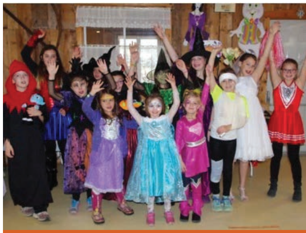
Des jeunes bien fiers.

Une activité remplie de sourires, de gaieté, d'optimisme! Une activité réussie!