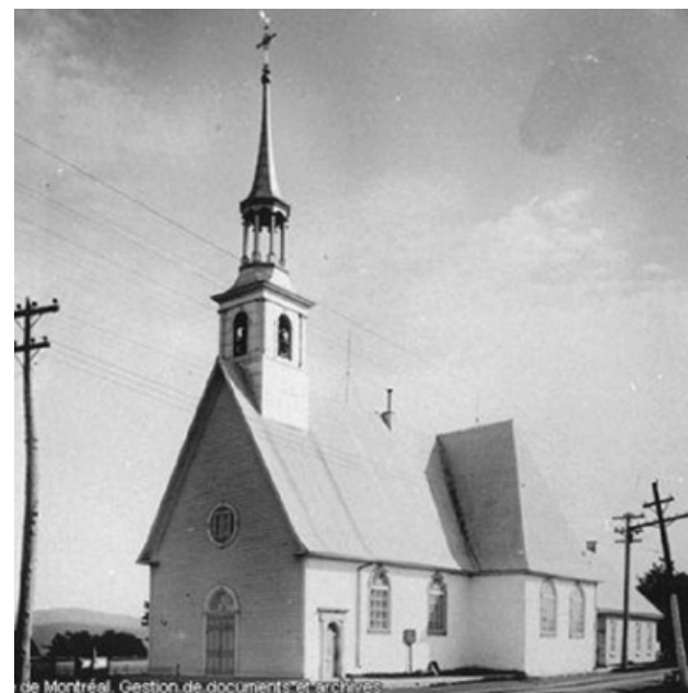
Ancienne église de Saint-Pierre, Île d'Orléans, avant 1928 - Edgar Gariépy, Fonds Edgar Gariépy, G-266, Archives de la Ville de Montréal. © Archives de la Ville de Montréal