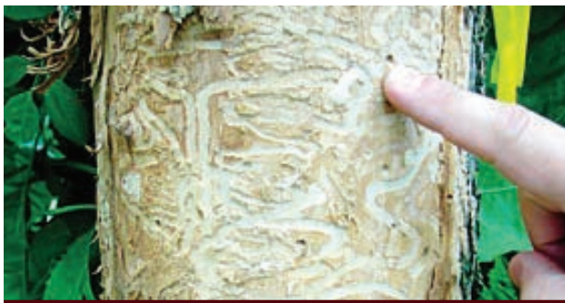
Galleries sinueuses creusées par les larves d' Agrilus planipennis . Le 10 juillet 2017, l'Agence canadienne d'inspection des aliments (ACIA) et la Ville de Québec confirmaient publiquement la présence de l'agrile du frêne sur le territoire de la ville de Québec. C'est dans le cadre du programme municipal de détection précoce par écorçage qu'une larve a été trouvée sous l'écorce d'une des 400 branches prélevées sur des frênes municipaux en 2017.