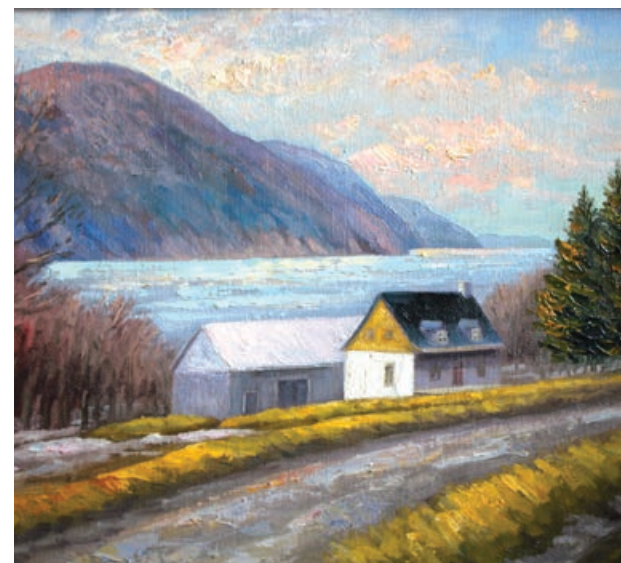
Route d'Argentenay, huile sur toile, Cathy Lachance.

Nous félicitons les heureux gagnants et tenons à remercier la Caisse Desjardins de L'Île-d'Orléans qui nous a offert ces œuvres à titre gracieux.