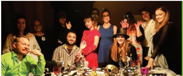
Cette année, à l'occasion de l'Halloween, l'équipe de la Fondation François-Lamy a transformé la Maison de nos Aïeux en véritable aire de jeu à la manière de «Clue». Les participants furent accueillis dans notre manoir hanté où ils étaient invités à résoudre l'énigme du meurtre de François Lamy. L'activité réalisée en partenariat avec le comité des loisirs de la Municipalité de Sainte-Famille a réuni plus de 200 personnes qui ont franchi les portes de l'ancien presbytère.

taires, les personnalités et les participants pour leur généreuse contribution, mentionnant que les sommes recueillies permettront la poursuite des activités du parc et la mise en place de projets de développement. Tous ont été conviés à s'y rendre la saison prochaine afin de voir les différentes expositions et de participer aux nombreuses activités offertes. Une carte de membre a été remise à chaque participant.