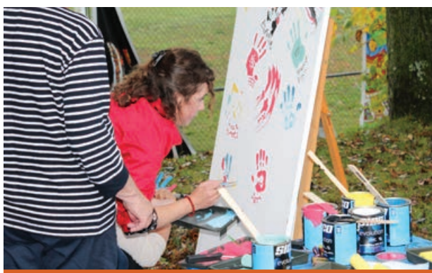
BLEU rayonne par la force du nombre.

Découvrez nos artistes sur notre site internet: www.bleuartistes.com