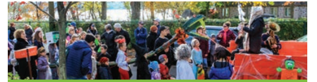
L'Halloween pour les 7 mois à 97 ans!

Ce petit mot est pour la remercier du fond du cœur au nom de tous les parents. Vous êtes d'accord avec moi: «Faut pas se gêner pour dire publiquement qu'on apprécie et qu'on est reconnaissants!» Comme quoi l'Halloween, ça n'attire pas seulement les vampires et les sorcières: il y a de bonnes fées!