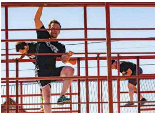
La course comptait de nombreuses épreuves, de la course à pied à l'escalade.

Du 22 avril au 12 août se tiennent plusieurs compétitions. Organisée par Blackout Race, cette série d'épreuves culminera lors de la grande finale à Rigaud, en fin de saison. Si l'une des épreuves a eu