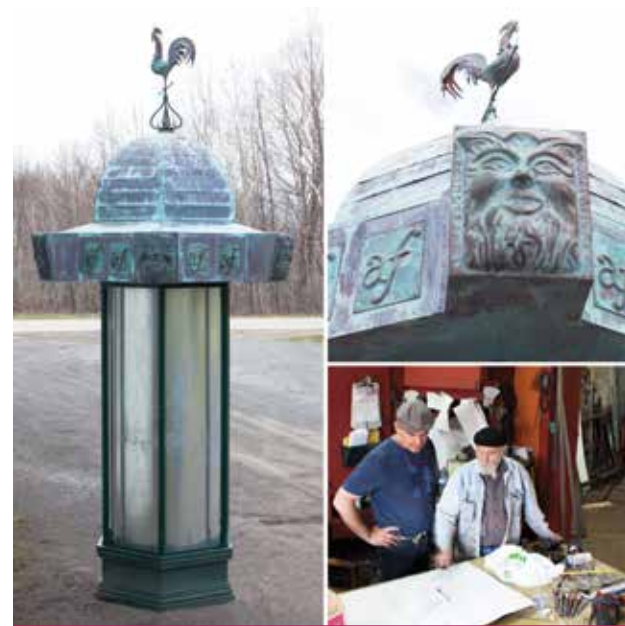
À gauche: la colonne Morris destinée à l'Alliance française de Toronto. À droite, un détail du chapeau et les deux artistes dans l'atelier de la Forge à Pique-Assaut.

Il est de toutes alliances des effets d'hybridation insoupçonnés. Le résultat n'est pas une simple addition, mais plutôt une multiplication des contribu-