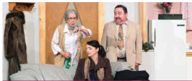
Le Nouveau Théâtre de l'île présentera la pièce Un pied dans la bouche jusqu'au 3 septembre.

Pour plus de renseignements et pour l'horaire complet des représentations, rendez-vous au www.nouveautheatredelile.com