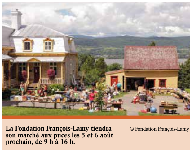
La Fondation François-Lamy tiendra son marché aux puces les 5 et 6 août prochain, de 9 h à 16 h.

Dans le but de léguer aux générations actuelles et futures un espace collectif auquel les habitants de l'île d'Orléans pourront s'identifier et dont ils pourront être fiers, la Fondation François-Lamy s'occupe du Parc-des-Ancêtres, situé en arrière de la Maison de nos Aïeux. Ce dernier est l'un