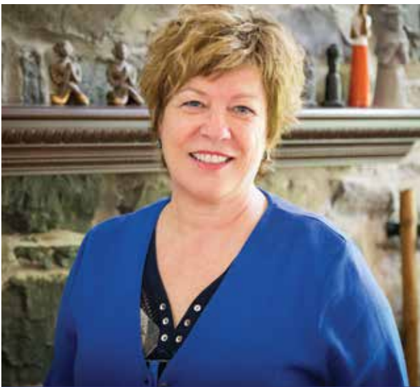
L'honorable Lucie Rondeau.

Interrogée sur les défis à relever, la nouvelle juge en chef cite notamment la question des délais pour arriver à procès en matière criminelle. Un jugement récent de la Cour suprême du Canada, l'arrêt Jordan, est venu précipiter la nécessité de trouver des solutions aux délais trop longs, dits «déraisonnables», qui peuvent être jugés inconstitutionnels dans certains cas.