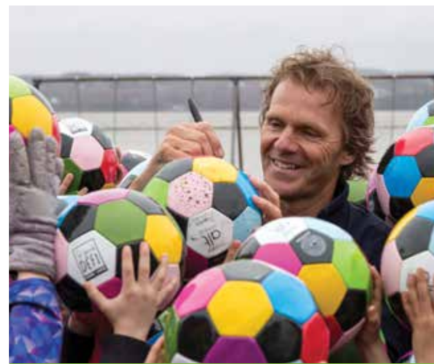
En collaboration avec le Groupe Germain Hôtels, tous les élèves de l'école de l'île ont reçu un ballon de soccer dans le cadre du Grand Défi Pierre Lavoie. Lors de la remise des ballons, Pierre Lavoie fut littéralement submergé par les demandes d'autographes.