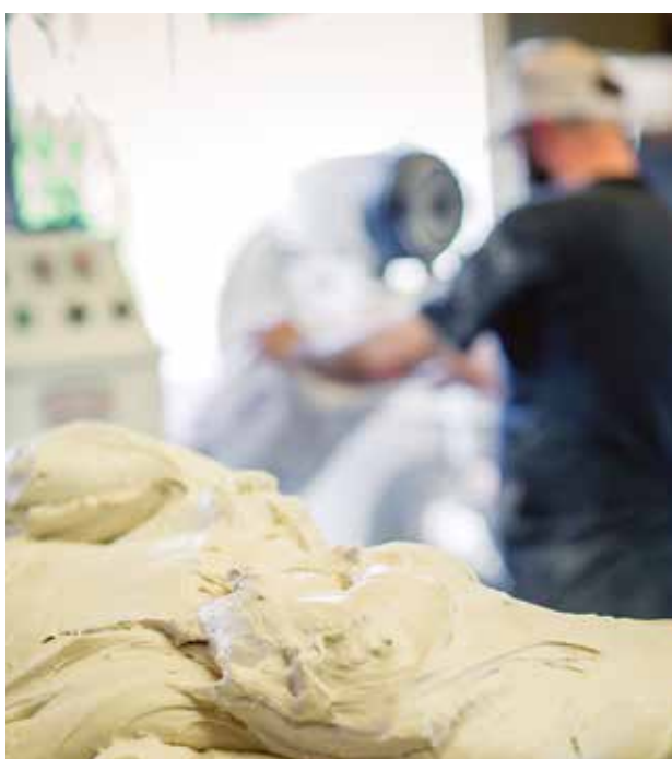
Même si les méthodes de travail se sont raffinées, la production demeure artisanale.