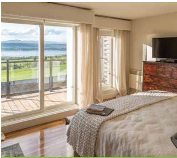
Après un important agrandissement, les propriétaires de l'Auberge les Ancêtres étaient heureux de faire visiter les nouvelles chambres de l'auberge lors d'un 6 à 8 inaugural.