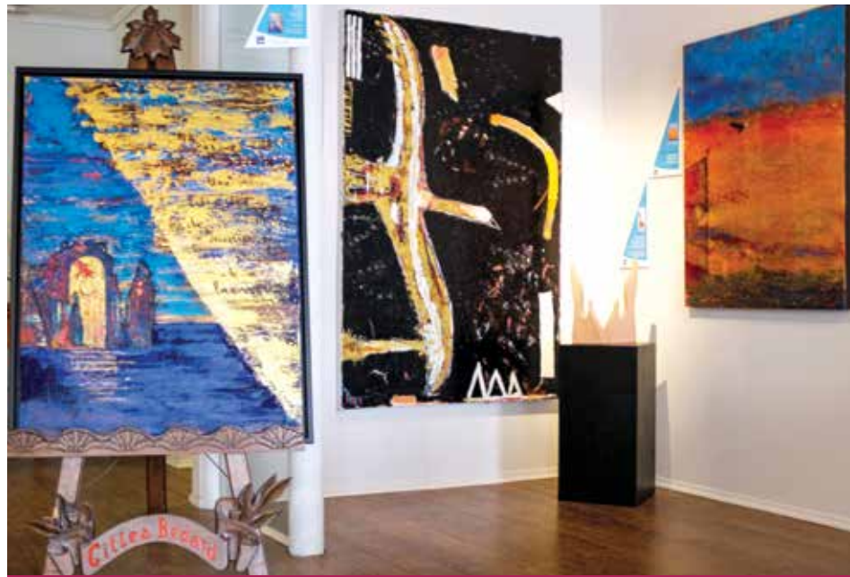
29 artistes ont participé au grand projet Traversée .