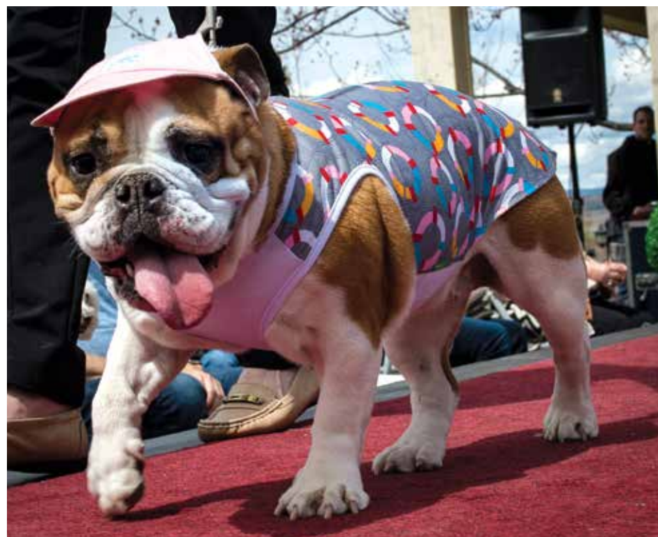
Le 13 mai dernier, la boutique Chien Mondain, de Québec, organisait une parade de mode canine à la Grange de l'Île. L'événement regroupait 38 participants et une cinquantaine de chiens.

Afin de faciliter le processus pour ses citoyens, la municipalité de Saint-Laurent procédera finalement elle-même à l'envoi des demandes d'autorisation au MCC.