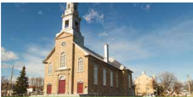
Église de Saint-Laurent.

La procédure suivie pour les réaménagements juridiques des paroisses est régie par le Code du droit canonique et la Loi des fabriques. Tous les documents requis pour l'unification de nos deux paroisses seront