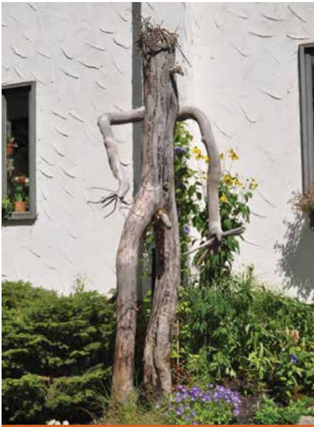
Hermaphrodite, collection privée.