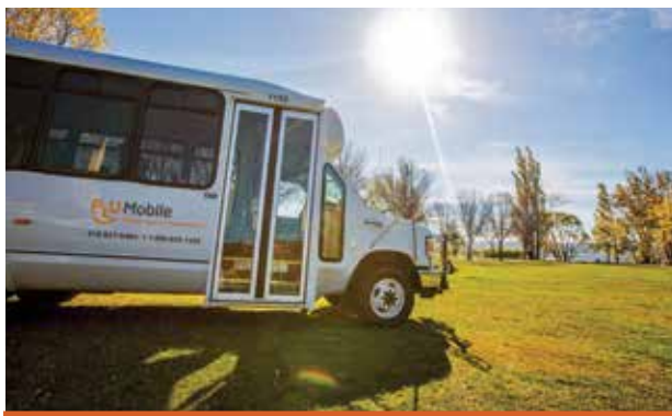
Retour des navettes vers le Festival d'été de Québec.

Pour le retour, l'embarquement se fera au coin des rues Saint-Joachim et Honoré-Mercier. Le coût sera de 5 $ par passage (10 $ aller-retour). Les laissez-passer mensuels (PLUMobile et métropolitain) seront aussi acceptés. Autre nouveauté pour cette