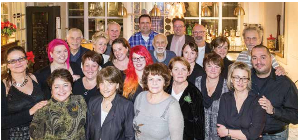
Toute l'équipe d' Autour de l'île vous souhaite de très joyeuses Fêtes!

Si Autour de l'île peut être fier de célébrer ses 20 ans, la route ne s'est pas faite sans heurts et sans défis à relever. À chaque étape, une équipe de bé-