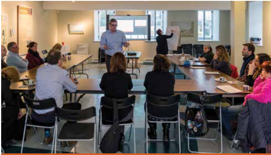
GPS organise des formations destinées aux entrepreneurs sur des sujets variés, gratuites pour les membres.

Si le réseau GPS a de grands objectifs, tel le ressourcement sur le plan professionnel, l'acquisition de connaissances ou la concertation sur