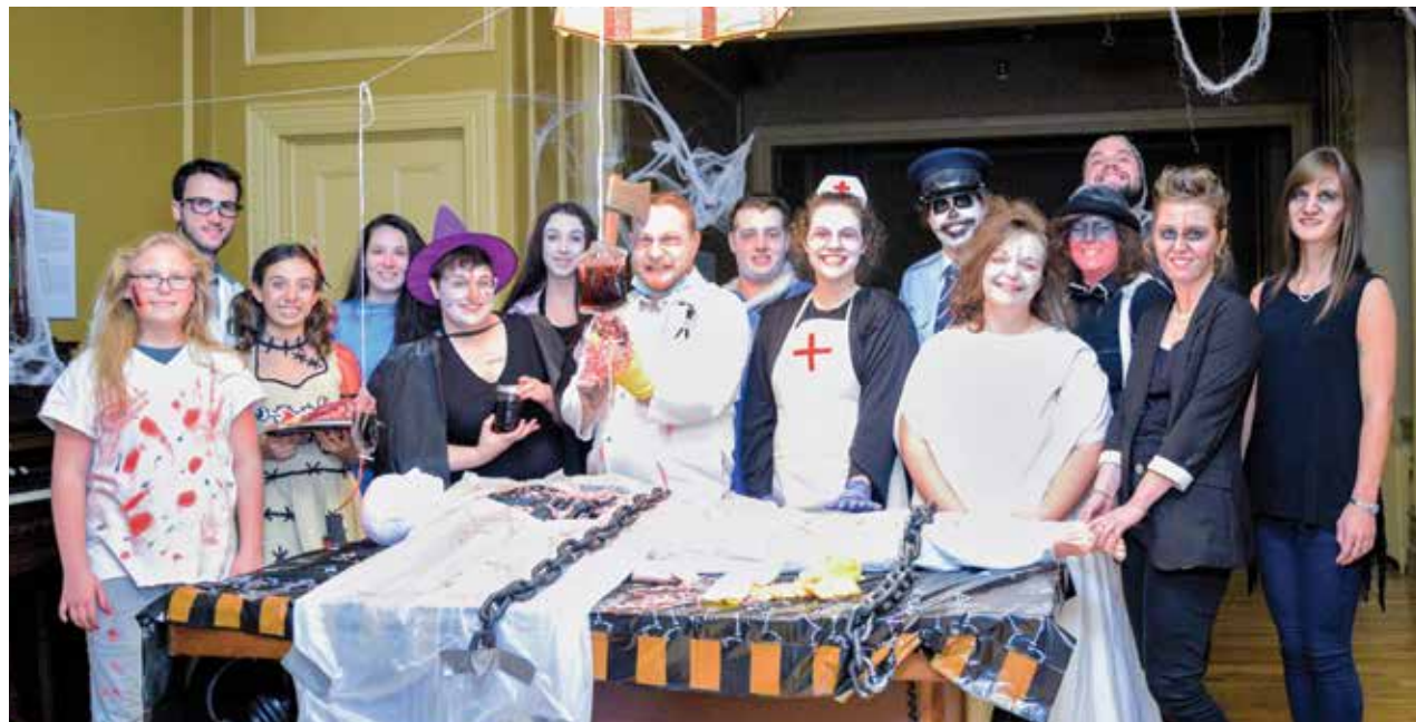
La Fondation François-Lamy a tenu la 2 e édition du Presbytère hanté .

La Fondation François-Lamy a amorcé ce mois-ci sa campagne de financement et de membership 2016-2017 avec comme objectif de récolter un montant supérieur à 8 000 $.