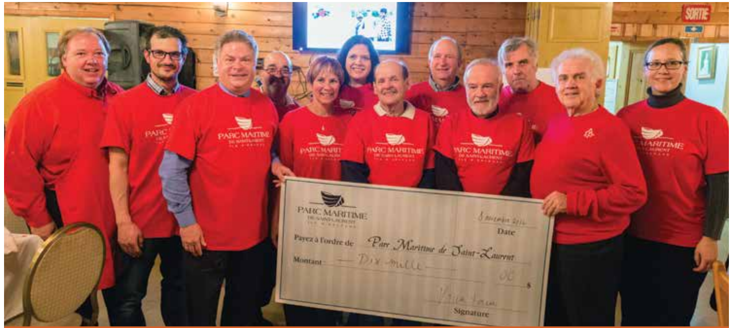
Douze personnalités ont joué le rôle de serveur d'un soir et ont contribué à faire un succès de cette édition.