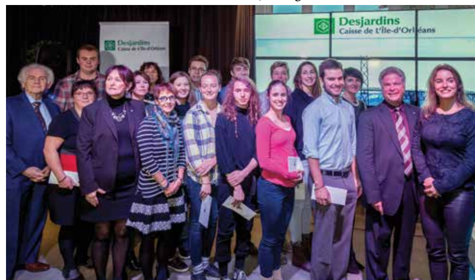
Les gagnants des bourses jeunesse Desjardins 2016.