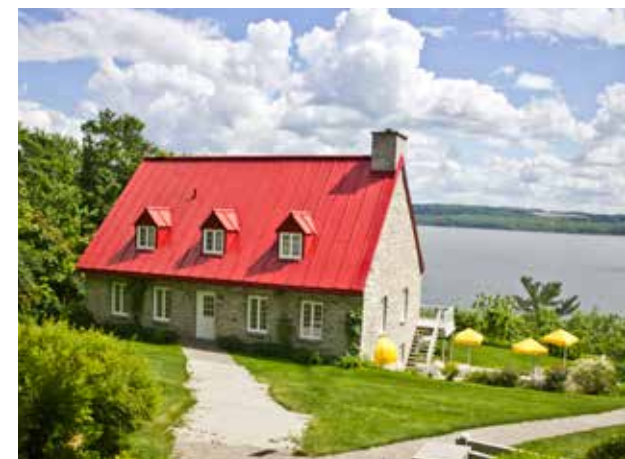
Les responsables de la Galerie Boutique Pétronille attribuent le succès de la saison 2016 à la belle température.

Toutefois, il paraît certain que plusieurs autres commerces situés dans la zone des travaux à Saint-Laurent ne pourront tirer des conclusions aussi favorables de leur saison 2016.