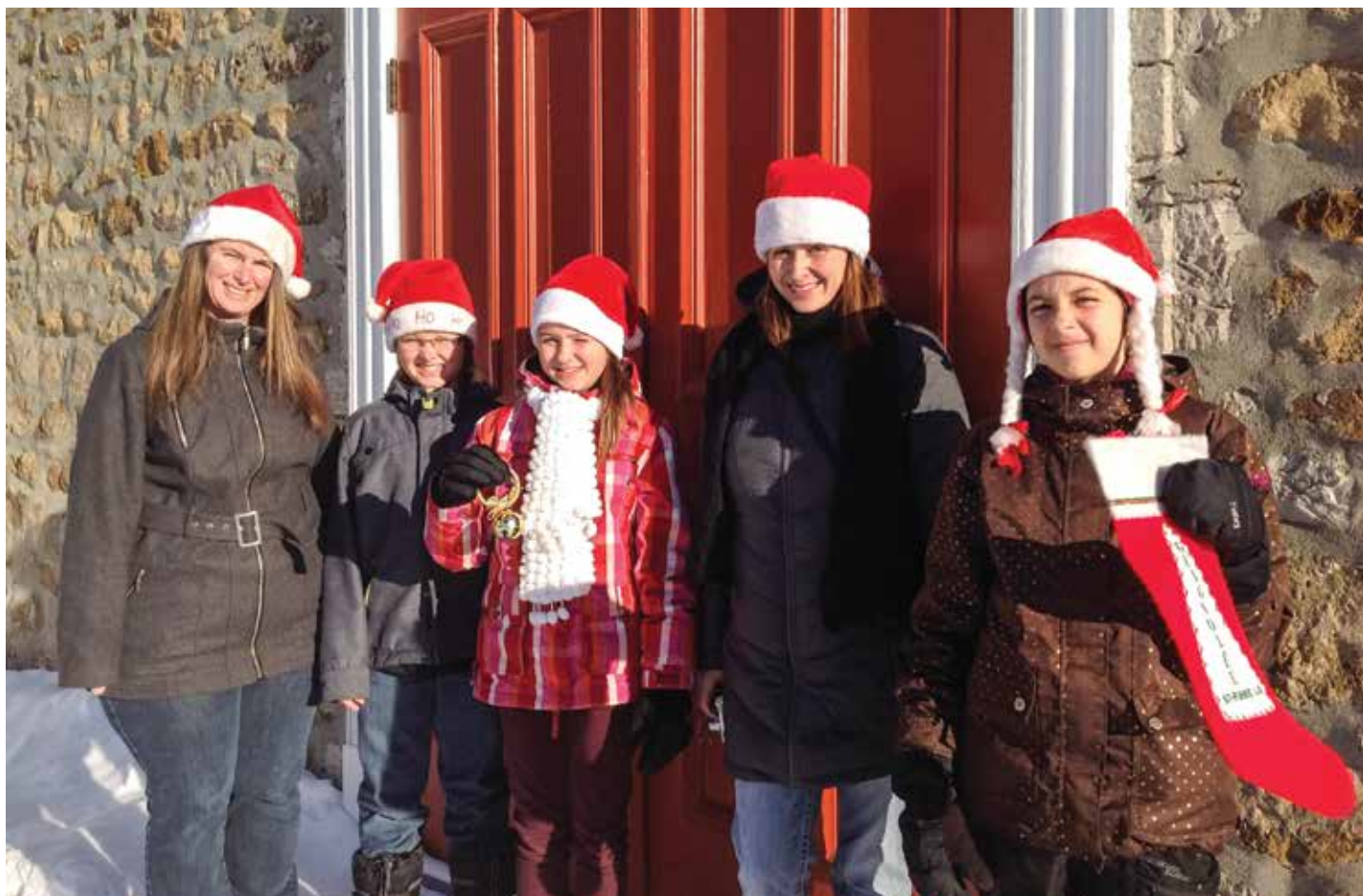
Profitez de l'approche des Fêtes pour partager avec générosité lors de cette journée de guignolée. Sur la photo des bénévoles d'une édition précédente.

Vous aimeriez vous joindre à l'équipe de bénévoles pour la guignolée? Ne manquez pas de téléphoner au 418 828-2359 pour donner votre nom.