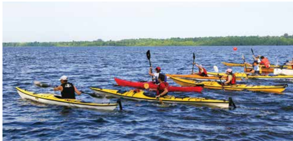
Kayaks sur le fleuve Saint-Laurent.

Un événement spécial, le Festi-Kayak de l'île d'Orléans, aura lieu pour une première fois à l'occasion de la fête du Nautisme, le samedi 9 juillet 2016. Le Festi-Kayak : c'est une grande randonnée guidée entre Sainte-Pétronille et le Parc maritime de Saint-Laurent. Après la randonnée, les participants pourront casser la croûte entre eux au Parc maritime tout en échangeant sur leur expérience. L'information complète pour vous inscrire à cet événement vous sera communiquée dans les semaines