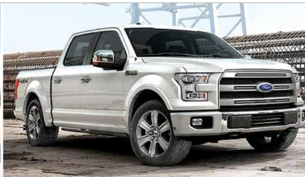
PHOTO À TITRE INDICATIF. LOCATION 60 MOIS, 16 000 KM. / ANNÉE, 1 000$ COMPTANT OU ÉCHANGE ÉQUIVALENT, TAXES EN SUS. DÉTAILS SUR PLACE.

FORD F-150 XTR 4X4 SUPER CREW MOTEUR 5.0 LITRES, RATIO 3.73, GROUPE REMORQUAGE, CAMÉRA DE RECU ET BEAUCOUP PLUS !