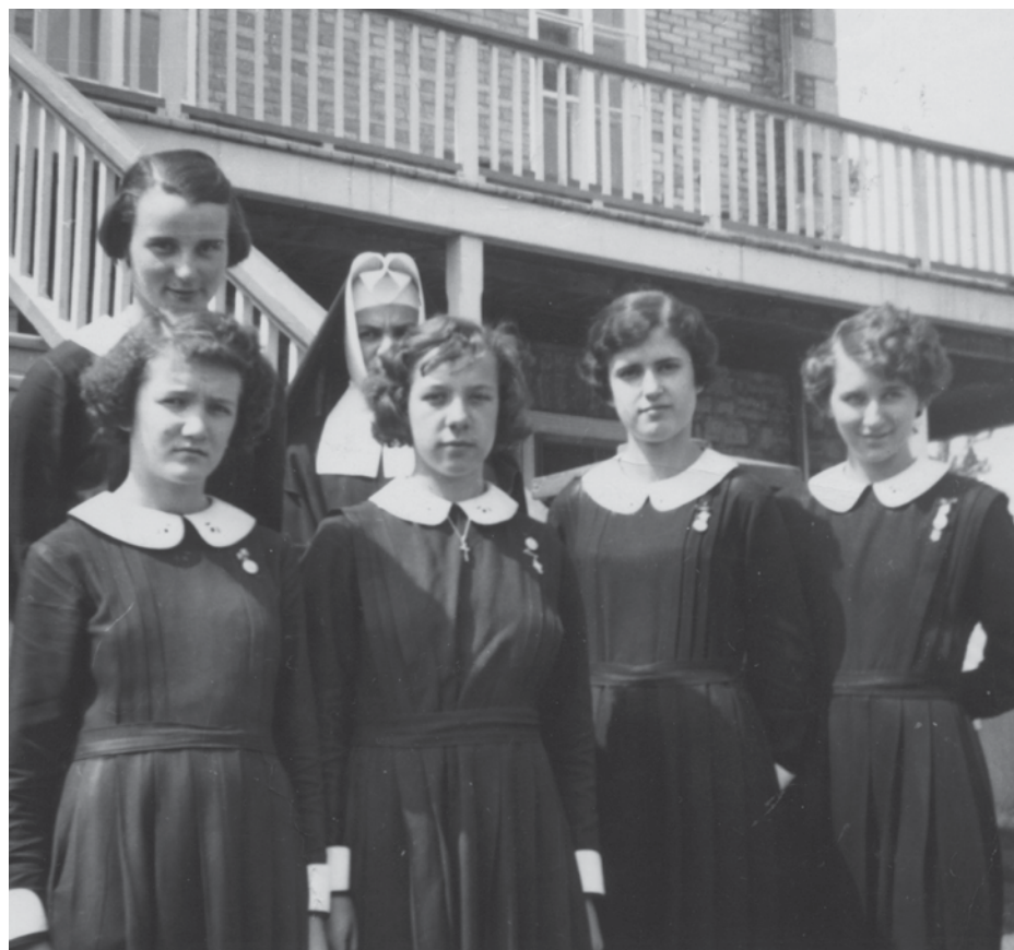
Jeunes filles devant le couvent de Saint-Laurent.

Une représentation gratuite aura lieu le vendredi 13 novembre à la salle multifonctionnelle de Saint-Laurent, au 1330, chemin Royal, à 19 h. Café et biscuits seront servis gratuitement après le visionnement du documentaire.