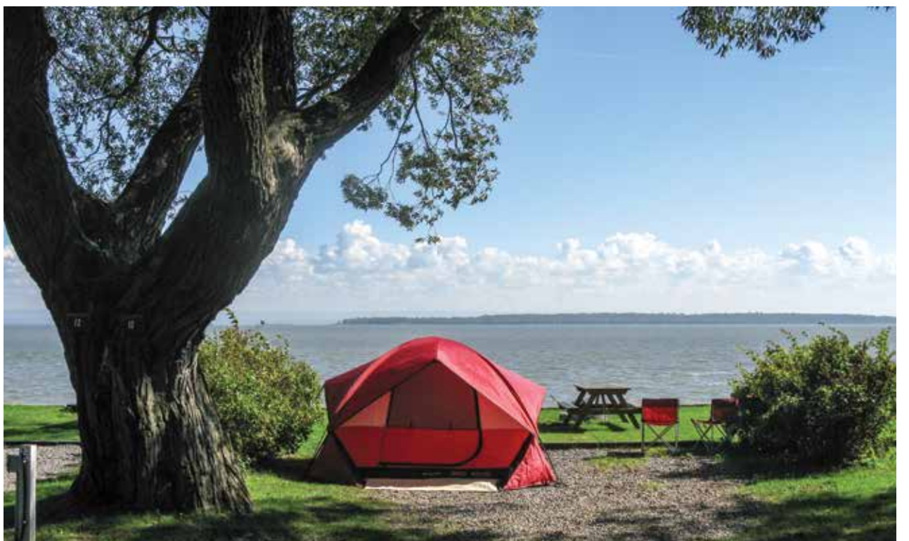
Le Camping Orléans est le seul camping classifié cinq étoiles dans la région de Québec.

Les Grands prix du tourisme canadien sont remis annuellement par l'Association de l'industrie touristique du Canada afin de souligner le succès, le leadership et l'innovation au sein de l'industrie touristique canadienne, et aussi de récompenser les individus, lieux, organisations et événements s'étant surpassés afin d'offrir des expériences touristiques de qualité supérieure au Canada.