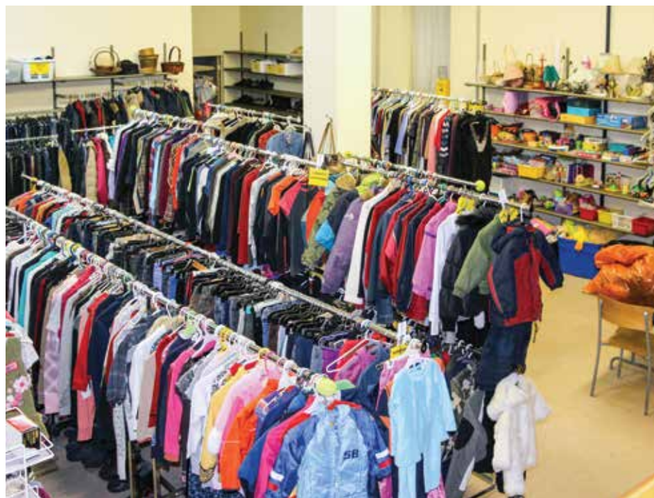
Le Comptoir de partage a 30 ans.

Une vingtaine de bénévoles y consacrent des heures de travail à diverses tâches dont l'administration, le triage et l'installation des