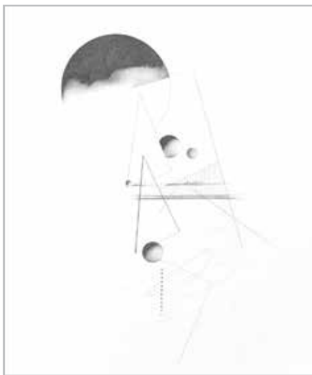
Anne-Yvonne Jouan, sans titre (exposition Construction/Déconstruction, le présent suspendu ), graphite sur papier, 28 X 24 po.

Faisant coexister l'abstraction géométrique et le figuratif, les œuvres