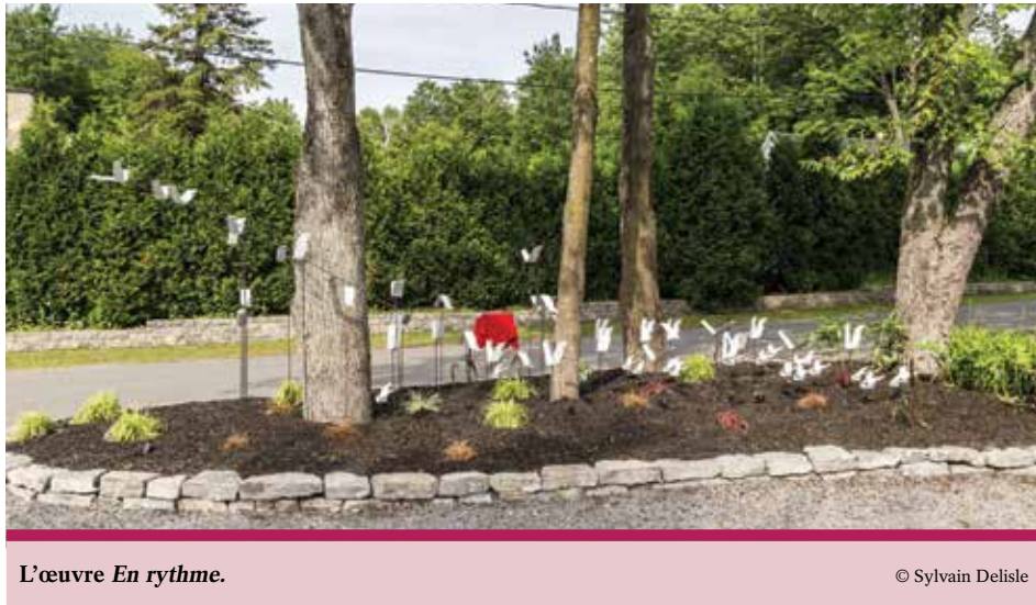
L'œuvre En rythme .