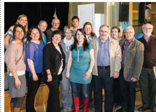
Depuis 2013, le comité de pilotage travaille à la création d'une politique de la famille et des aînés pour l'île d'Orléans.

En deux temps, cette journée se voulait à la fois fête familiale et lancement officiel. Si les enfants et les familles étaient nombreux en après-midi, la population était aussi au rendez-vous en soirée. C'est environ deux cents personnes qui ont ainsi participé à cette journée.