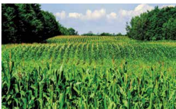
Roundup est le nom commercial d'un herbicide systémique produit par Monsanto dont le composant actif est le glyphosate. Certaines plantes génétiquement modifiées sont conçues pour y résister.

Pas étonnant, dans ce contexte, que la multinationale Monsanto et certains industriels du secteur se soient lancés dans une contre-attaque en règle arguant que l'étude du Circ avait écarté celles qui soutenaient que le glyphosate ne présentait pas de risques pour la santé humaine. D'autres rapports