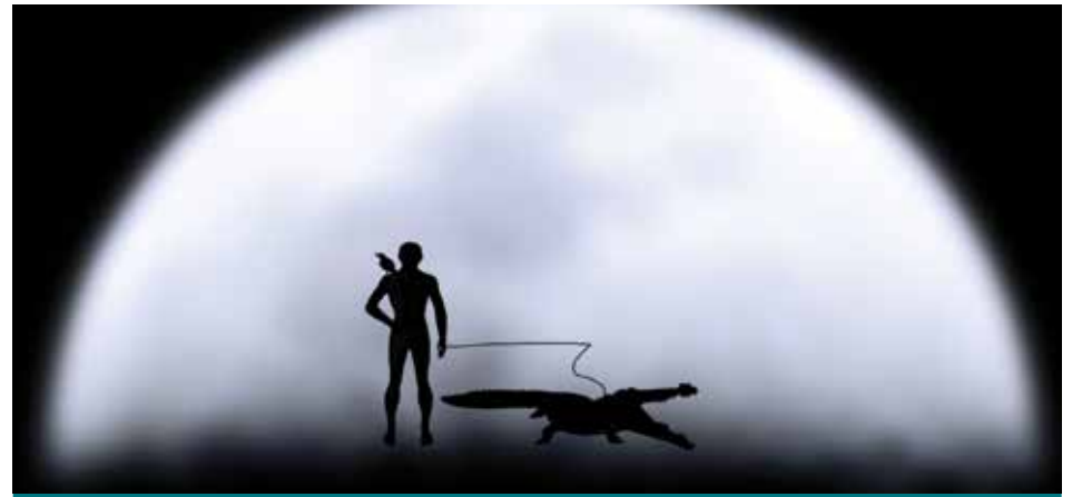
Homoreptilius, infographie, 2015.