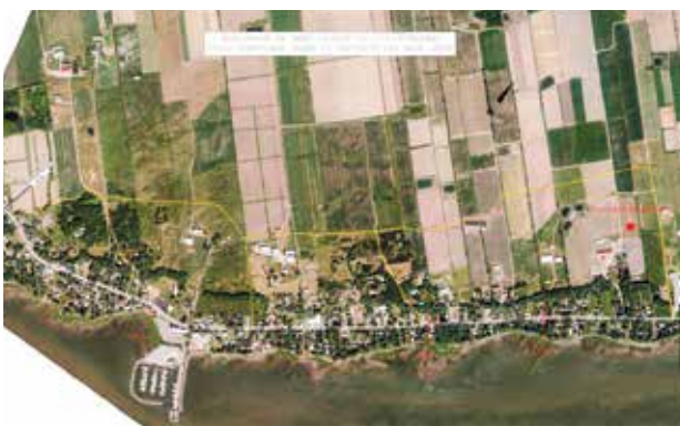
Le réseau de collecte des eaux usées touchera le secteur entre le 1093 et 1740, chemin Royal. Sur la carte : les voies de contournement durant la construction, en jaune, les postes de pompage (PP) et l'unité d'épuration, en rouge.

On connaît toutefois aujourd'hui une bonne part du tracé du réseau, l'emplacement des stations de pompage et de l'unité d'épuration des eaux usées. Des voies de contournement et un affichage adéquat sont prévus durant la période de construction pour assurer en tout temps, sauf pour la durée de la pose des conduites, l'accès sécuritaire aux résidences, aux commerces et aux services publics.