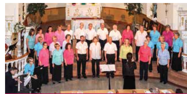
Le Chœur de l'Isle d'Orléans en concert à Sainte-Pétronille.

Le Chœur de l'Isle d'Orléans nous annonce que son prochain concert aura lieu le 13 décembre 2015, à l'église de Saint-Laurent. Il célébrera ses vingt ans d'existence en 2016 ; à cette occasion, la population sera invitée à des concerts et événements festifs. 32 choristes font partie de cette chorale et il est possible de se joindre à eux en se présentant à l'une ou l'autre des répétitions du 21 ou du 28 septembre 2015. Pour plus d'informations, visitez le www.lechoeurdelisledorleans.com