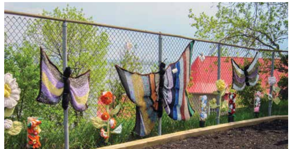
Murale en tricot réalisée dans le cadre du 100 e anniversaire des cercles de fermières.