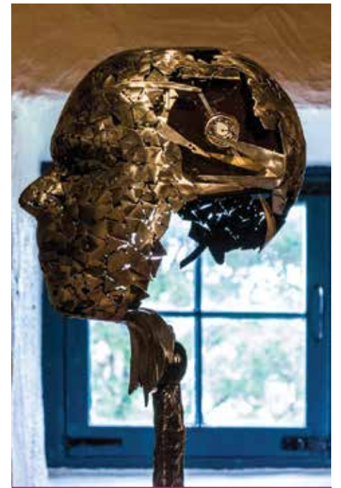
L'une des sculptures de l'artiste © Sylvain Delisle Philippe Pallafray exposée à la Maison Girardin.

Rappelons que La Maison Girardin est située au 600, avenue Royale, au cœur du site patrimonial de Beauport. Maintenant centre d'interprétation, la Maison Girardin est gérée par la Société d'art et d'histoire de Beauport depuis 1984. Pour plus d'informations, consultez le site web au www.sahb.ca/maisongirardin .