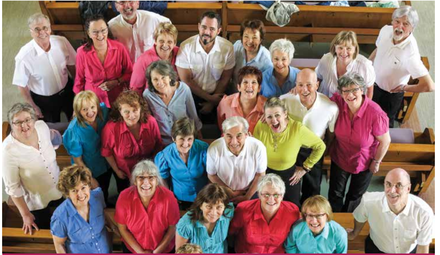
Les membres de la chorale lors d'une répétition.

Information : www.lechoeurde- lisedorleans.com et sur Facebook.