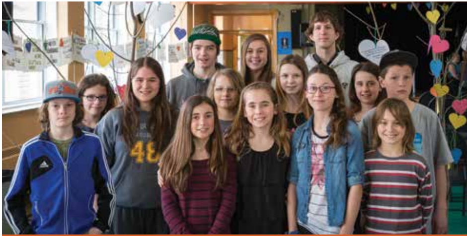
Les jeunes de la Maison des Jeunes de l'île d'Orléans étaient présent pour aider lors du lancement de la politique familiale et des aînés.