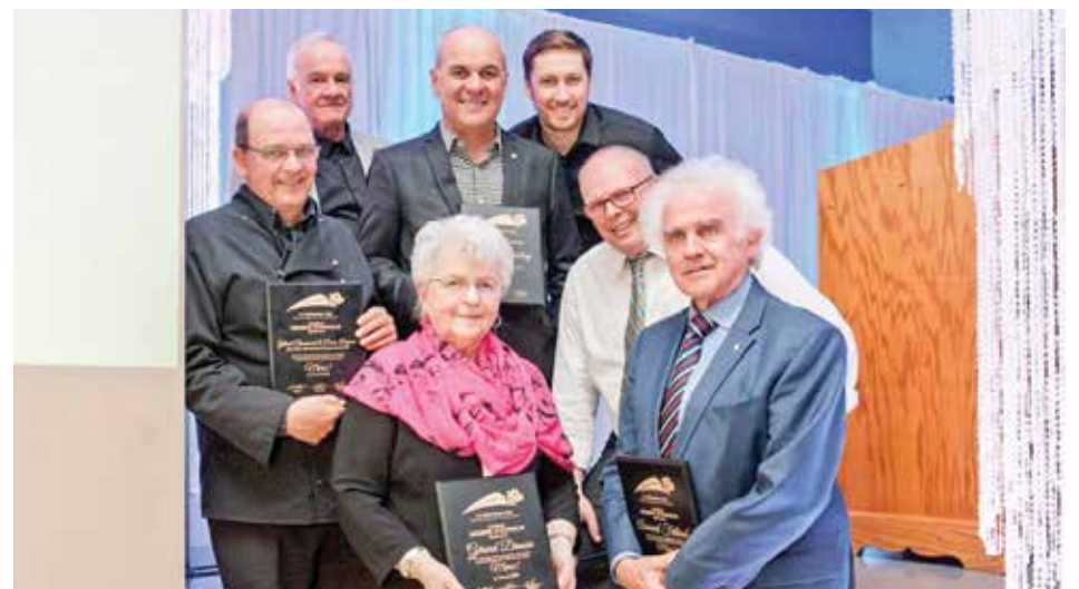
En plus de célébrer les 30 ans de La Télévision d'ici, la soirée fut aussi l'occasion de rendre hommage à quelques personnes.

Toutes nos félicitations à La Télévision d'ici à l'occasion de son 30 e anniversaire et pour la réussite de cette magnifique soirée.