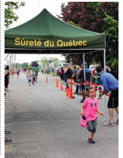
Comme l'an passé, les jeunes courent dans la route des Prêtres, fermée pour l'occasion.