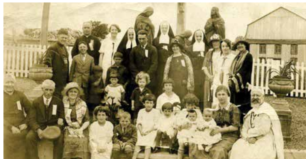
Inauguration du calvaire vers la fin des années 20.

Leurs ateliers à Chicago, à New York ainsi qu'en Italie, près de Carrare, reconnu pour son marbre. Vingt ans plus tard, Rigali, un autre italien, vint les rejoindre. « La Deprato Rigali Statuary Company se spécialise, au tournant du XX e siècle, dans la statuaire religieuse. Elle produit des statues en marbre, en scagliola (technique imitant le marbre), en granit et en pierre.