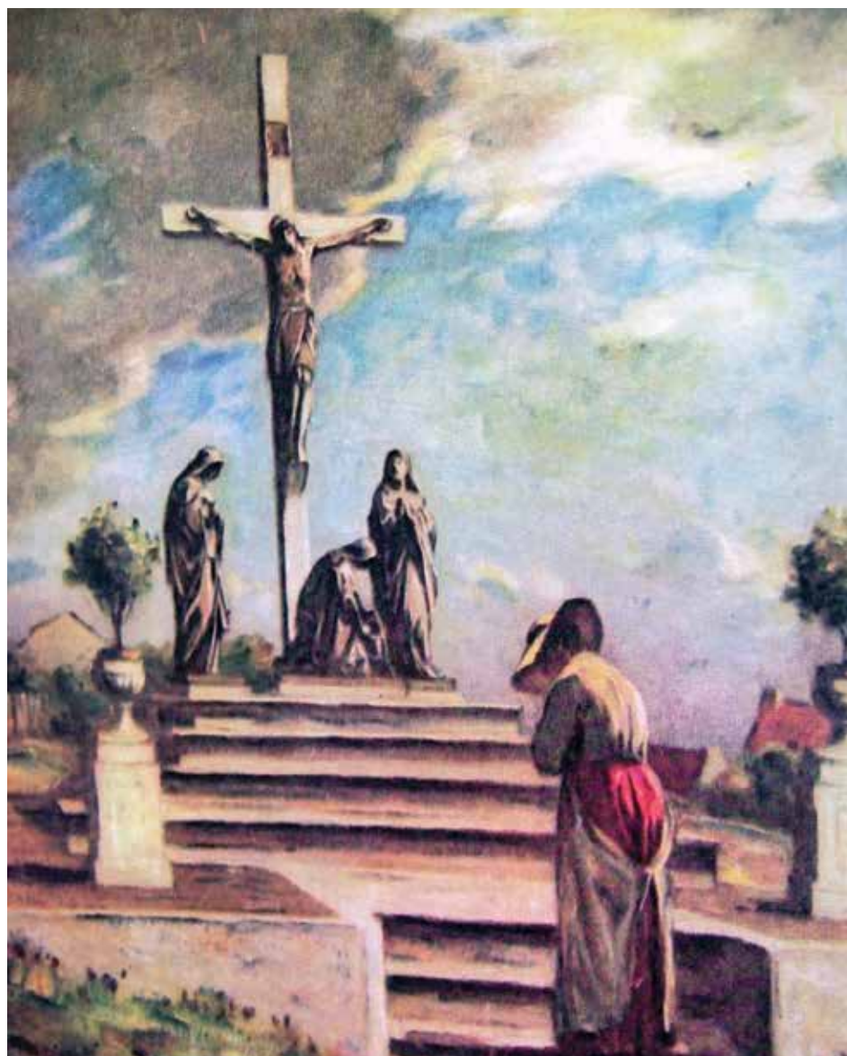
Calvaire de Saint-Laurent , une oeuvre du peintre Horatio Walker.

Le peintre Horatio Walker (1858-1938) a représenté ce calvaire dans une œuvre intitulée Calvaire de Saint-Laurent . Ce peintre d'origine ontarienne reçut une formation de dessinateur avant de devenir peintre et d'occuper le marché de l'art nord-américain pendant quelques décennies. Il fut photographe et graveur en plus de toucher également à l'aquarelle et à l'huile. Walker, nommé le chantre de l'île d'Orléans, peignit dans ses tableaux la nostalgie et la composante ethnique. L'art d'Horatio Walker est aujourd'hui associé au patrimoine collectif : « Walker exprime quelque chose de l'authenticité vivace de l'un des peuples fondateurs. » 3 Il décéda le 27 septembre 1938 et fut inhumé dans la chapelle anglicane de Saint-Pétronille-de-l'Île-d'Orléans.