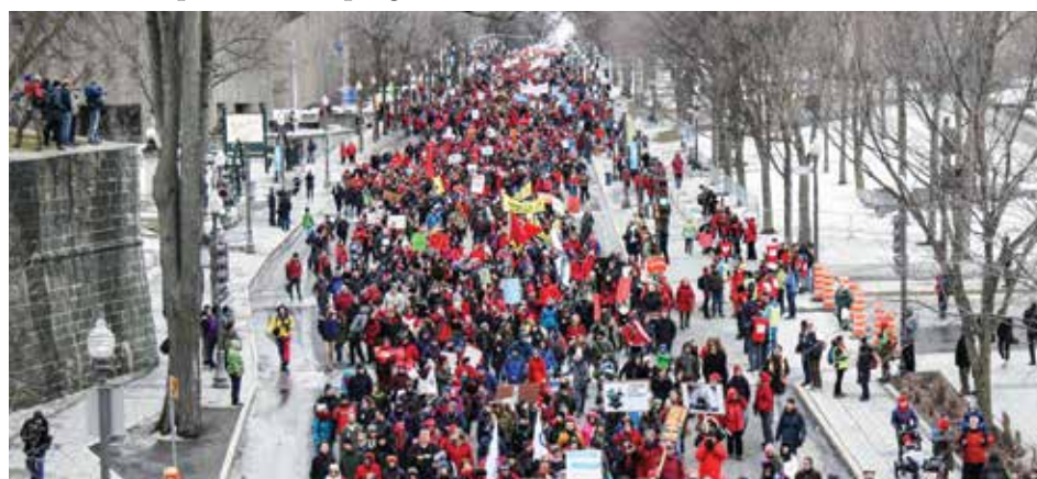
La manifestation du 11 avril 2015 à Québec, appelée par Action climat.