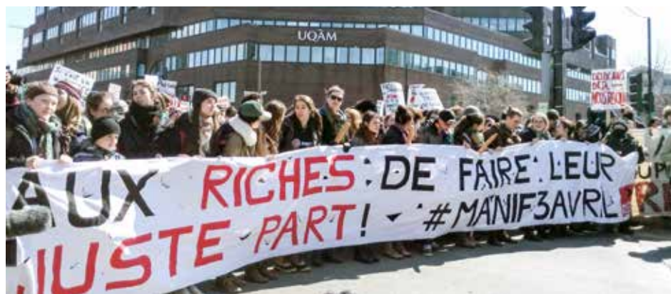
Les étudiants de l'UQAM ont été au cœur de la grève du printemps 2015.

S'il est vrai que l'on ne peut saccager le bien public, il est vrai égale-