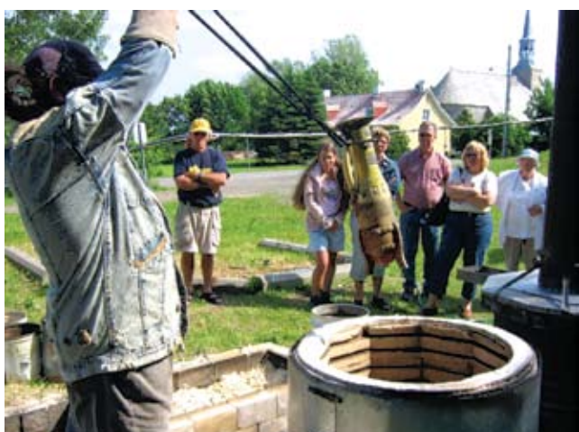
CLD de l'île-d'Orléans