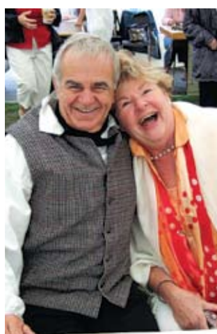
CLD de l'île-d'Orléans

Cette publication a été tirée à 10 000 exemplaires, dont 4 500 encartées dans l'édition régulière du journal Autour de l'île , août 2011.