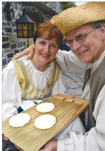
PHOTO : LA FROMAGERIE LES FROMAGES DE L'ISLE D'ORLÉANS