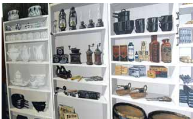
Une fresque représentant l'étalage de la marchandise en vente dans un magasin général d'antan.